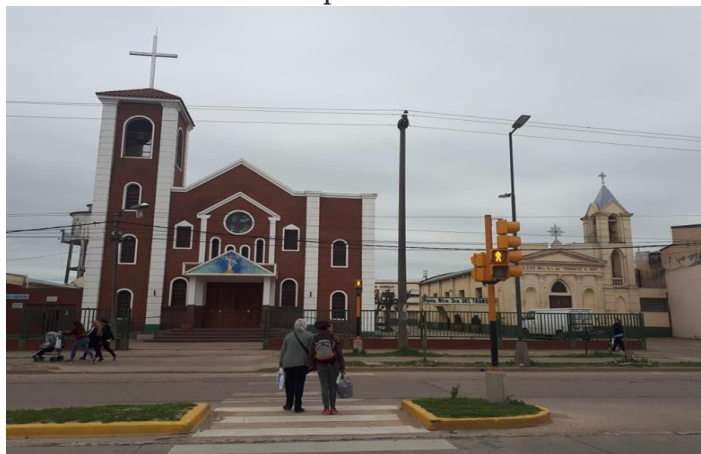
Vista del frente de la Parroquia Nuestra Señora del Tránsito