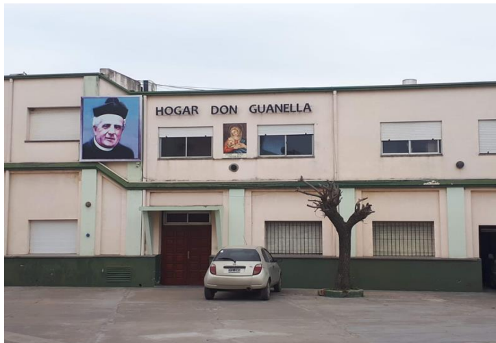
Vista del frente del HDG

En las imágenes se puede observar el frente del HDG y de la parroquia Nuestra Señora del Tránsito, que se encuentra en el mismo predio: