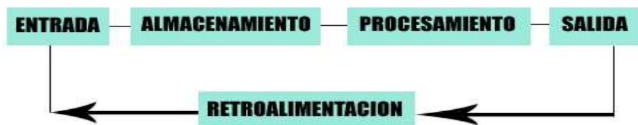
Fig. 1. Componentes de un sistema de información. Adaptado de Stair y Reynolds (1999).

Este “ciclo” se completa con un quinto paso descrito como retroalimentación , que es la salida que se devuelve al personal adecuado de la organización para ayudarle a evaluar o corregir la etapa de entrada, en caso de errores existe la necesidad de corregir estos, incluso no solo los datos de entrada, sino también algún proceso que no satisfaga total o parcialmente la información de salida deseada o esperada.