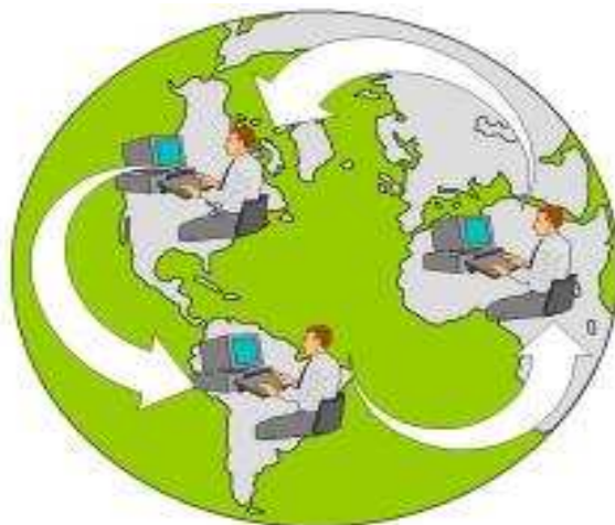
Figura 3: disponible en línea < http://ronsteven.wordpress.com/2011/03/30/comercio-electronico/ > (consultado el 15 de junio del 2013)