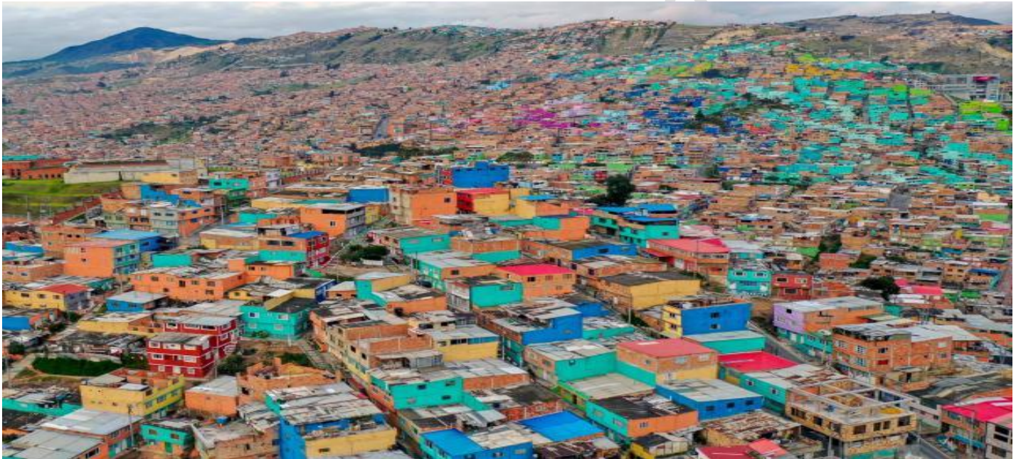
Figura 1. Ciudad Bolívar