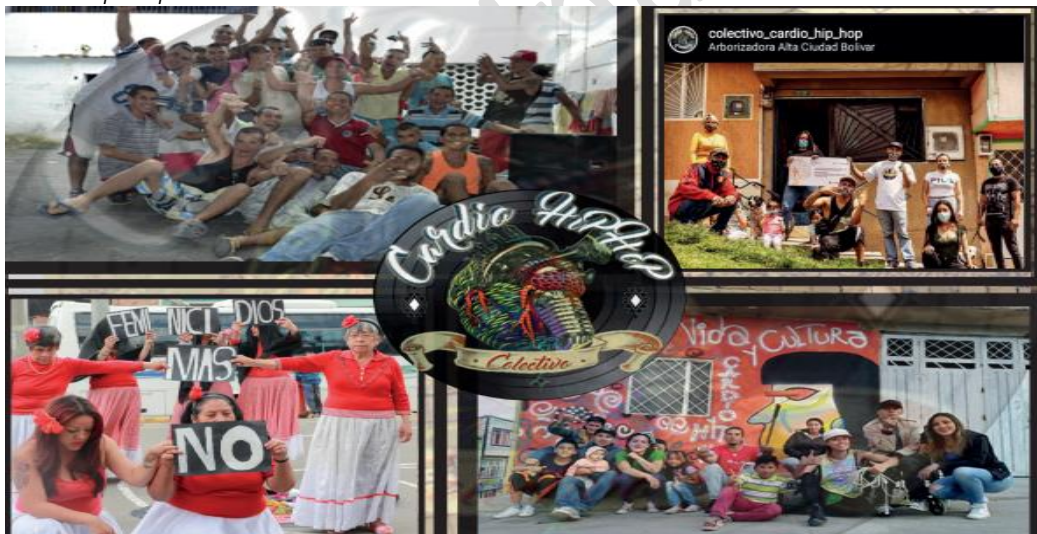
Figura 2. Cardio Hip Hop