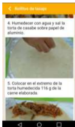
Figura 2. Descripción Rollitos de tasajo.

También se agregan las instalaciones turísticas donde se ofertan y en los casos más significativos la reseña histórica. (Figura 3).