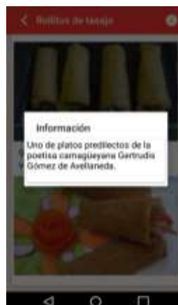
Figura 3. Información del Rollito de tasajo

La aplicación resultado contiene 32 recetas, (en español e inglés) con la posibilidad de incrementar el número de elaboraciones.