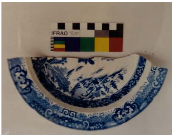
Figura 2. Fotografía de un fragmento de loza incluida en el informe técnico de la excavación en Casa Molina (Mujica 1998).

un intento de demolición también suspendido, el estado de conservación del edificio fue empeorando con el paso de los años quedando totalmente desmantelada su cubierta, sin puertas, ni ventanas, afectando en muchos casos a la estabilidad de algunos muros y sus revoques de barro, dejando al descubierto las estructuras de muros de piedra y ladrillos cocidos, propios de algunas de sus etapas constructivas (Figura 3).