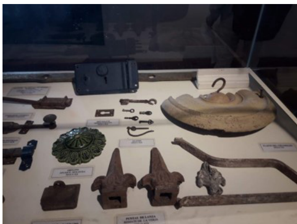
Figura 4. Interior de una de las vitrinas del actual Museo Antropológico y Arqueológico Casa Martínez.

En posteriores remodelaciones al convento y sectores interiores del mismo fue posible identificar una cisterna, así como otros elementos de cultura material (algunos de períodos recientes), aunque sin intervención de un profesional arqueólogo (Mariño 2014). Prácticamente una década más tarde, en el año 2014 se realizó una nueva obra de refacción en el convento, en esta ocasión en el interior del templo, por lo que se llevó a cabo una intervención arqueológica. Durante la misma se recuperaron restos óseos que fueron trasladados para su determinación a la Facultad de Ciencias Exactas de la UNNE, acordándose con las autoridades eclesiásticas el reentierro de aquellos restos que resultaran humanos 4 .