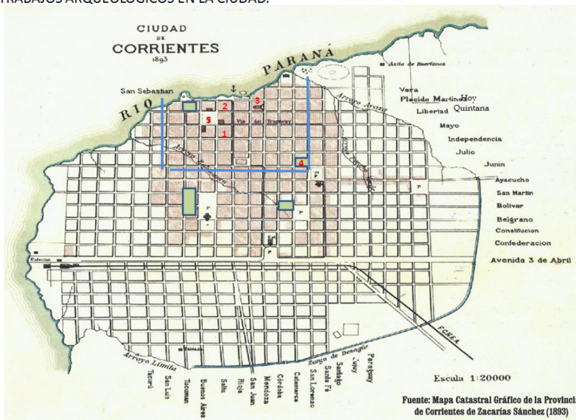
Figura 1. Plano de la ciudad de Corrientes con los sitios arqueológicos localizados en el ámbito urbano: 1- Plaza 25 de Mayo; 2- Casa de los Molinas; 3- Casa Martínez; 4- Convento San Francisco; 5- Plaza Cabral.

demolición de gran parte de los muros quedando en pie solo un pequeño sector. Esta situación originó diversas gestiones desde la Municipalidad y agrupaciones de vecinos y se obtuvo la donación de ese sector de dos habitaciones hacia la calle (Núñez Camelino 2015). Los trabajos arqueología de rescate, consistentes en excavaciones de pozos de sondeos y trincheras, se practicaron durante los primeros meses de 1998 (Mujica 1998), acompañando las obras de refacción en el edificio histórico. La colección arqueológica recuperada, atribuida a los diferentes momentos de ocupación del espacio de la propiedad, consta de 25 cajas que contienen material óseo (principalmente de fauna), cerámico (incluye fragmentos de loza) (Figura 2), vidrio y metal (Mujica 1998). En la actualidad, funciona el Archivo Digital Histórico Municipal, acompañado de una muestra arqueológica