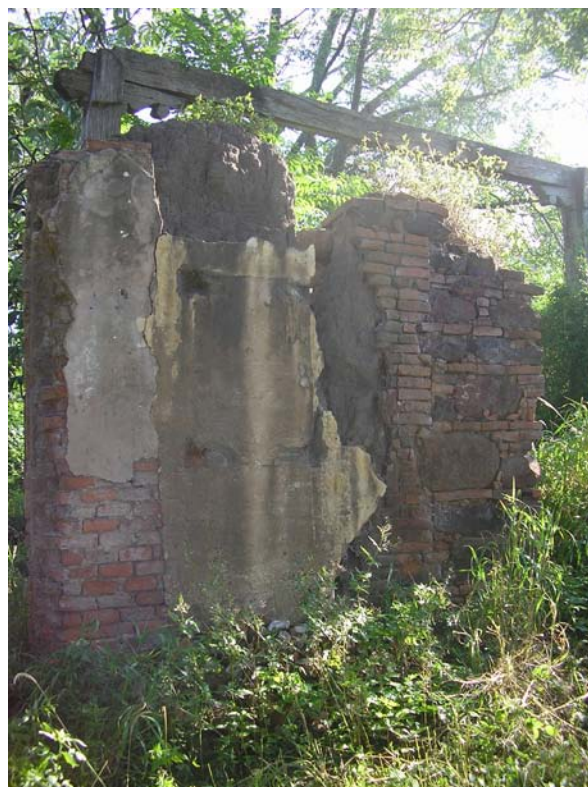
Figura 3. Aspecto de uno de los muros de Casa Martínez antes de las obras de refacción.

En los últimos años, las autoridades eclesásticas han emprendido diversas tareas de refacción y remodelación en el antiguo conven-