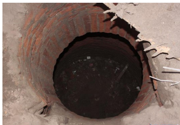
Figura 5. Pozo de agua hallado en la Plaza Cabral de Corrientes (Diario El Litoral 02/08/2012).

En el caso de este espacio, a partir de la información histórica, se conocía su uso como lugar de intercambios comerciales y, en consecuencia, se había constatado la presencia de un aljibe o pozo de provisión de agua que correspondería a una etapa anterior a los inicios del siglo XX en la cual la ciudad aún no contaba con un sistema o red de provisión de agua potable (Figura 5) (Sánchez Negrette y Lancelle 2013).