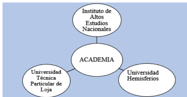
Figura 4. Actores Académicos del GA Ecuador

Nota: Actores que influyen en el GA en el Ecuador. Tomado de la página principal del (Gobierno Abierto Ecuador , 2023).