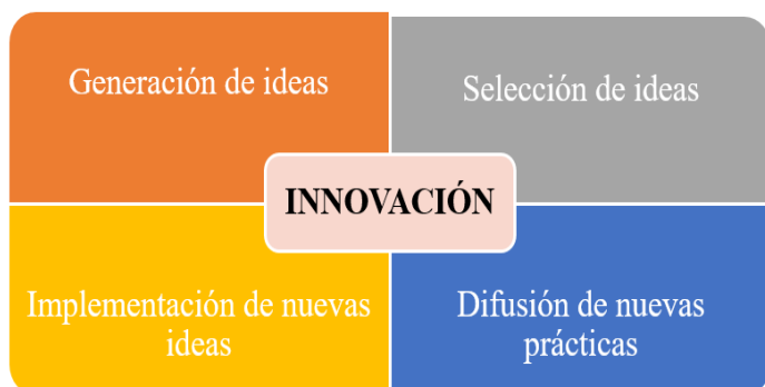
Figura 1.4 fases consecutivas en el ciclo de la innovación

Nota: En la siguiente figura se muestra las fases consecutivas que interviene en el ciclo de la innovación.