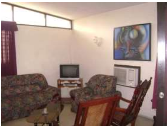
Hostal Clásico LA VISIÓN. Interior. Lobby.

Avenida General Cebreco No. 514 entre 19 y 23. Reparto Vista Alegre. Santiago de Cuba. Teléfono: (53 22) 643205