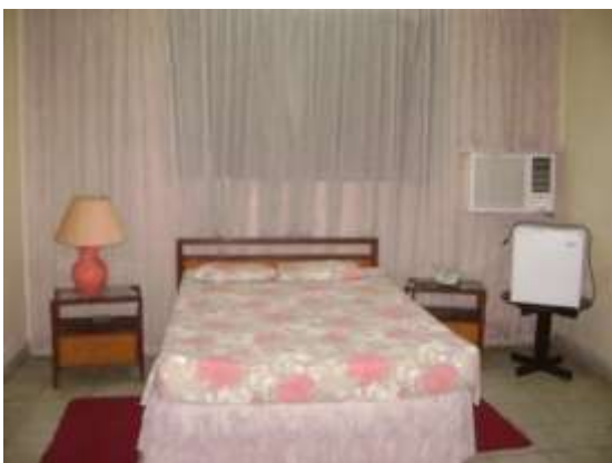
Hostal Clásico LA VISIÓN. Interior de las habitaciones