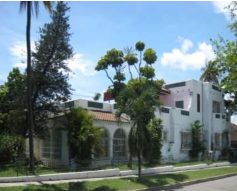
Hostal Clásico LA TORRE. Avenida de Manduley No. 357 esquina a 15. Reparto Vista Alegre. Santiago de Cuba. En proceso de mantenimiento y restauración con fecha de apertura 02/05/2012.