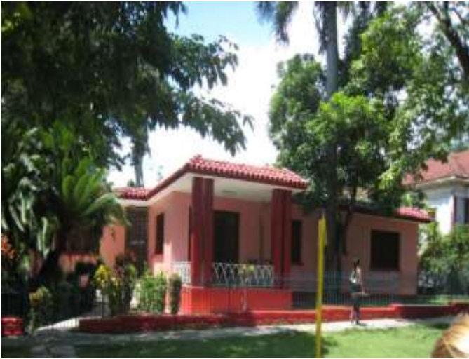
Hostal Clásico LA CONFRONTA. Avenida de Manduley No. 301 entre 11 y 13. Reparto Vista Alegre. Santiago de Cuba. Teléfono: (53 22) 649600