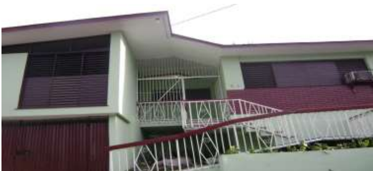
Hostal Clásico LA VISIÓN.

Avenida General Cebreco No. 514 entre 19 y 23. Reparto Vista Alegre. Santiago de Cuba. Teléfono: (53 22) 643205