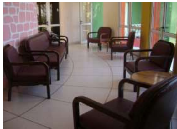
Hostal Clásico LA CONFRONTA. Interior: Lobby y Desayunador/Comedor.