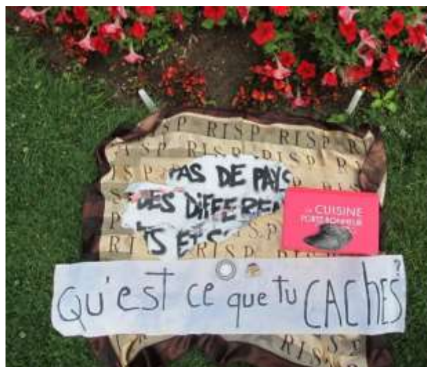
Imagem 2: Detalhe do despacho realizado em frente aos Invalides , mausoléu de Napoleão Bonaparte.