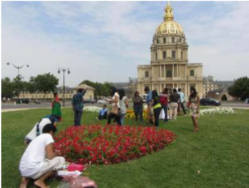
Imagem 1: Visão panorâmica da realização do despacho em frente aos Invalides , mausoléu de Napoleão Bonaparte e os turistas indianos