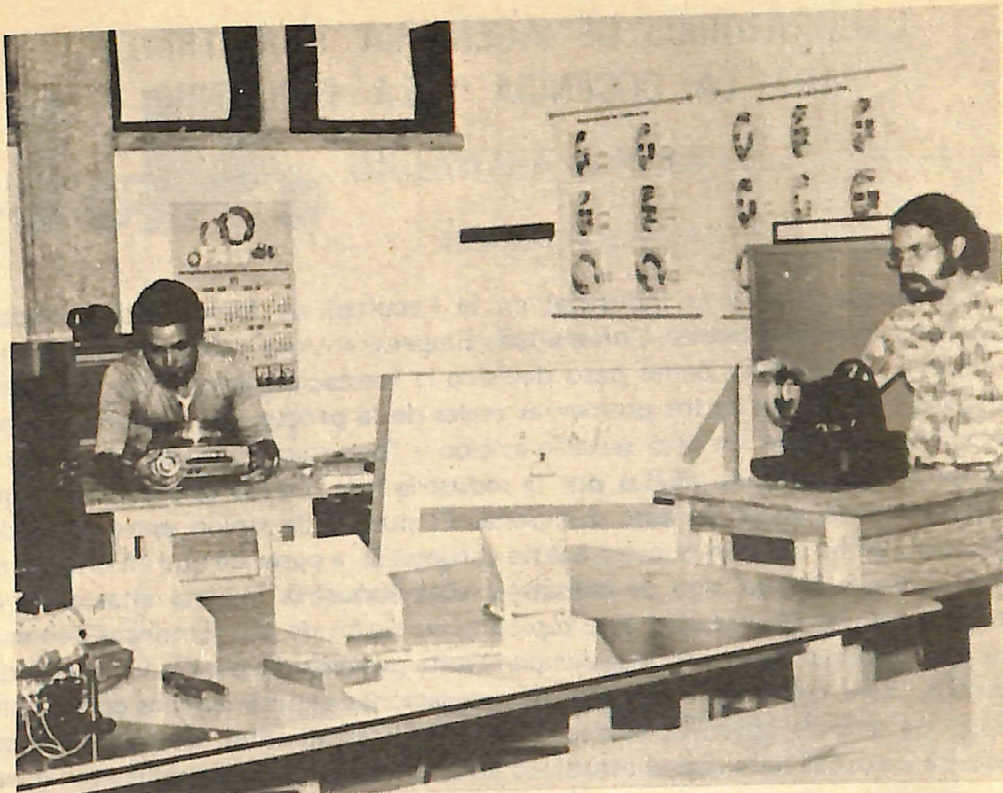
Personal del Laboratorio en ejercicio de sus funciones.