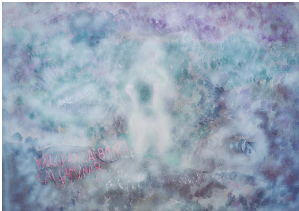
SIMON CONTRA Caminant damunt un mar de boira II

amb aquella successió de cases que són pura ostentació i diferenciació de cadascuna cap a les altres: la casa Lleó Morera de Domènech i Montaner, la casa Mulleras d'Enric Sagnier, la casa Bonet de Marcellà Coquillat, la casa Amatller de Puig i Cadafalch i la casa Batlló d'Antoni Gaudí.