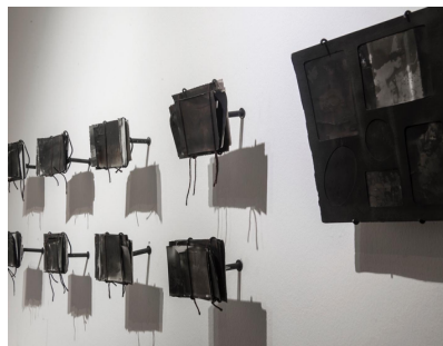
Ñamen. Desaparecer, venir en olvido (2017). Danilo Espinoza. Fotografías ahumadas. Medidas variables.

La serie da cuenta de las imposibilidades de reconstrucción de la memoria y de “una fractura irreparable de las genealogías que no se salda con el paso del tiempo y las generaciones” (Arfuch 53). Las fotografías del álbum familiar, “evocarían lo trágico” (Arfuch 53) desde su interrupción: ellas aludirían al quiebre del relato biográfico, signado por la desaparición y sus consecuencias.