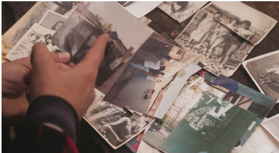
Fotograma del video documental Ñamen. Desaparecer, venir en olvido (2017). Danilo Espinoza.

militantes y de familiares acerca de la vida de su padre. Las fotografías se intercalan, en el habla digresiva de Vladimir, como un anclaje, como un señalamiento, reafirmando su condición de indicialidad. El relato que hilvana Vladimir, a través de las fotografías, es corrosivo y crítico: interpela a quienes no quisieron ver al interior de su propia familia. El álbum familiar da cuenta, desde la ausencia, de esa fractura al discurso cohesionador que supone la institución familiar, lo que es reforzado por las palabras de Vladimir.