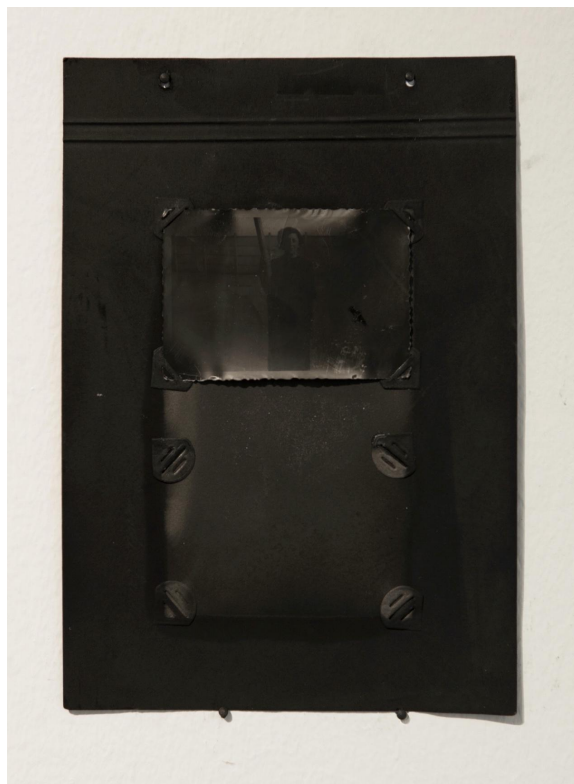
Ñamen. Desaparecer, venir en olvido (2017). Danilo Espinoza. Fotografías ahumadas. Medidas variables.