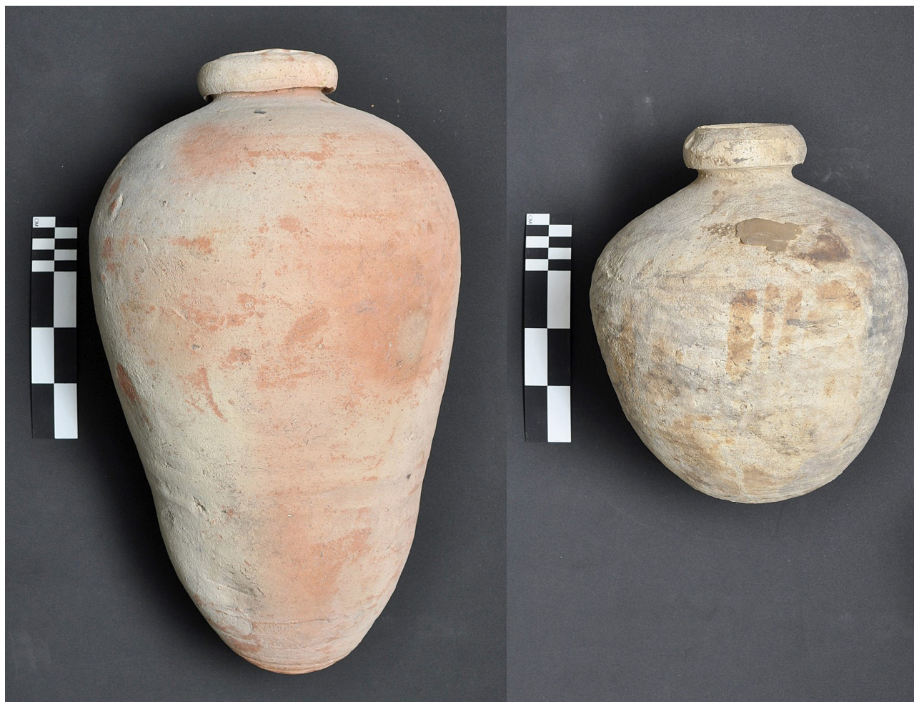
Figura 6. Botijos españoles de una y media arroba en la carga del barco.

La limpieza de estos envases en el laboratorio y el análisis de muestras sobre las sustancias y sedimentos en su interior, nos han brindado información sobre su contenido. Se pudo constatar la presencia de brea, resina de pino y olivas (Si bien por medio de observación directa constatamos la presencia de estos tres materiales en el interior de algunas botijas, se enviaron muestras al Laboratorio de Materiales del Instituto Valenciano de Conservación y Restauración de Bienes Culturales de la Generalitat de Valencia, España, en el mes de marzo del 2009. Es importante mencionar que el contenedor de una arroba que tenía en su interior los carozos de olivas fue hallado con tapón de corcho). Estos tres elementos sin duda formaban parte de la carga ya que se hallaron en el interior de los botijos. Los dos primeros posiblemente utilizados para el calafateo y reparación de los bajeles, tanto durante la travesía como también para comerciar en los puertos. Las olivas, provenientes entre otras de la península, eran muy comunes en el comercio con las colonias (Mena García, 2004; Sánchez Sánchez, 1996; Zunzunegui, 1965).