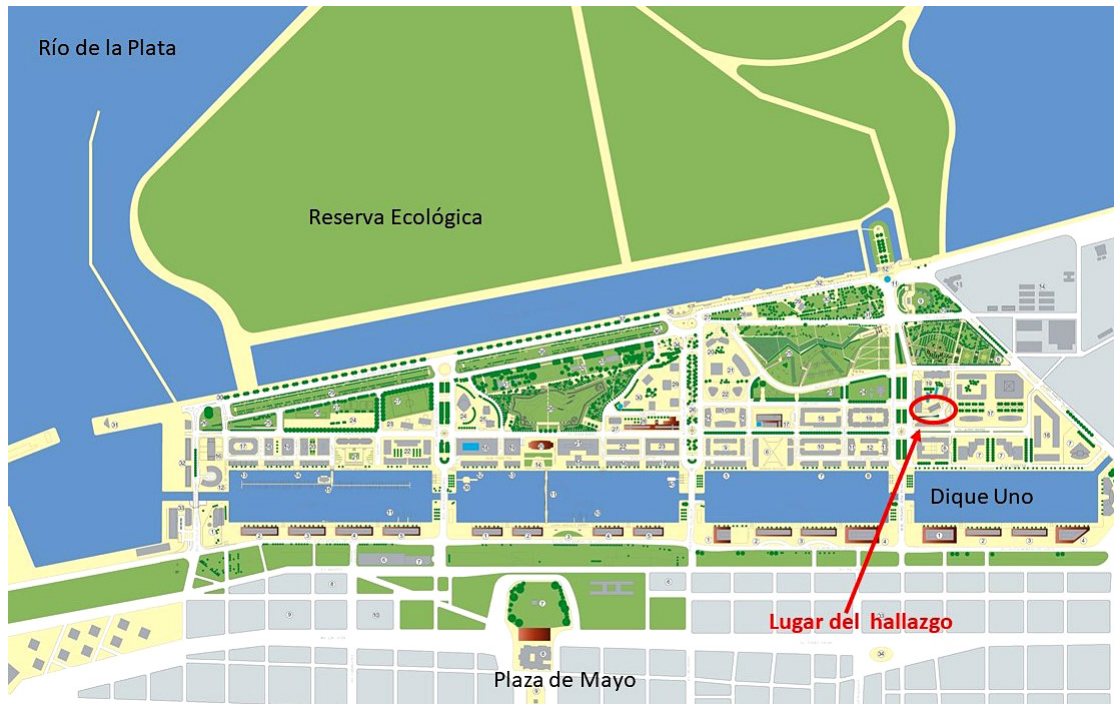
Figura 1. Localización del hallazgo en Puerto Madero, Buenos Aires. Plano Madero www.buenosaires.gov.ar