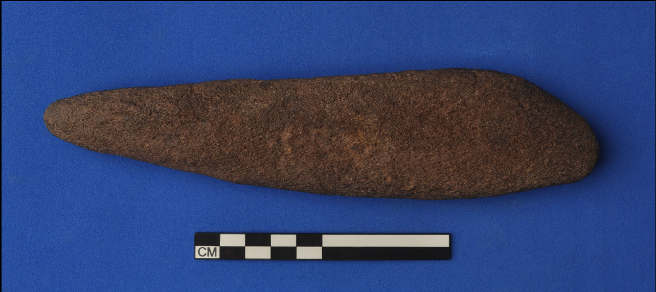
Figura 11. Instrumento "fid".