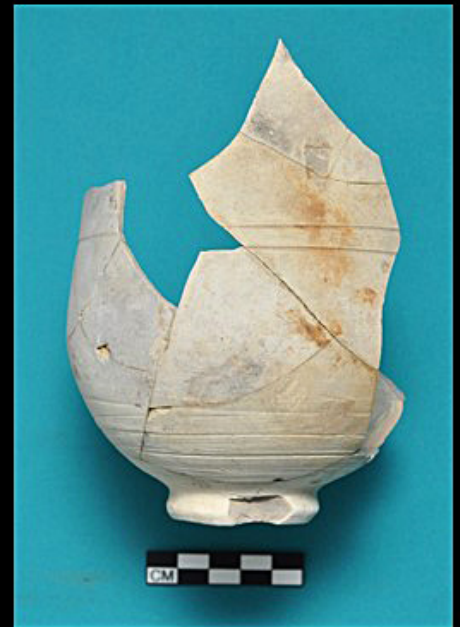
Figura 10. Distintas piezas de alcarrazas.