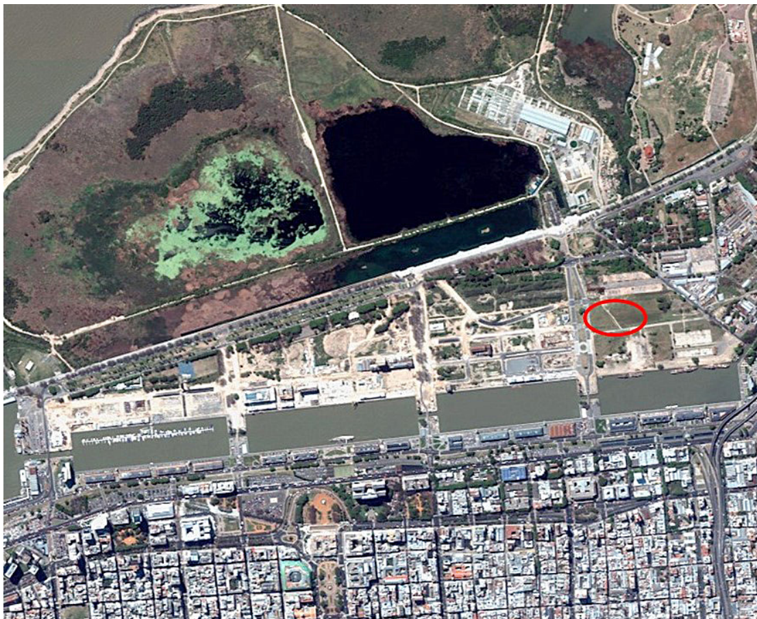
Figura 2. Fotografía satelital con ubicación del hallazgo