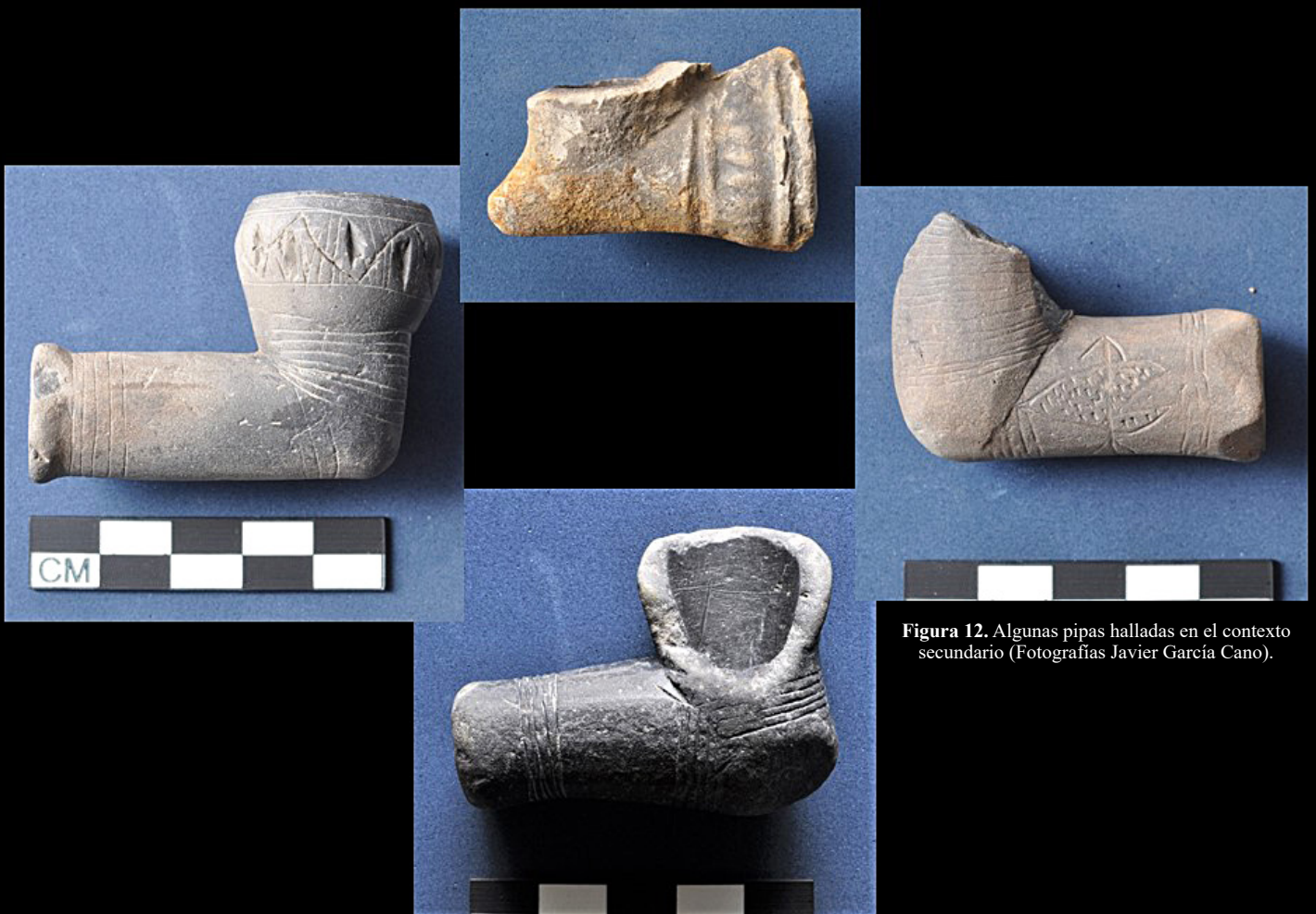
Figura 12. Algunas pipas halladas en el contexto secundario.