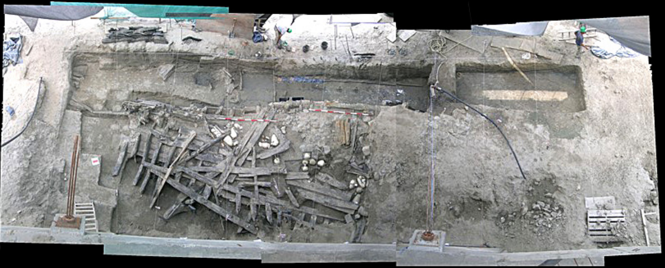
Figura 4. Procesos de excavación