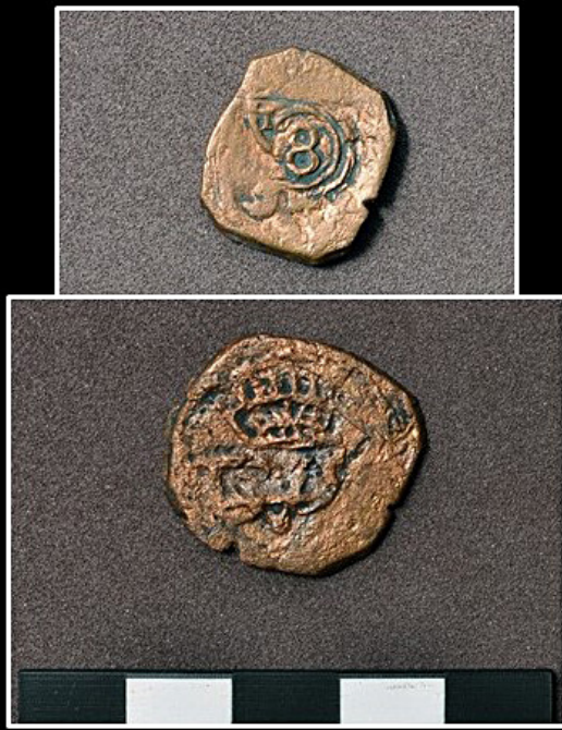
Figura 9. Resellos españoles.