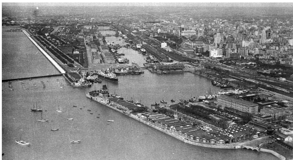
Figura 3. Vista de Puerto Madero desde Dársena Norte.

El Puerto de Buenos Aires fue, desde la conquista, un escenario o espacio de destino de diferentes tipos de mercancías, a bordo de naves que llegaron a estas tierras con materiales destinados a la ciudad y sus habitantes. En este capítulo presentaremos una selección de objetos recuperados, especialmente aquellos que formaron parte de la carga, porque refleja la diversidad de los bienes comerciales y la riqueza de los intercambios entre Buenos Aires y otras partes del mundo.