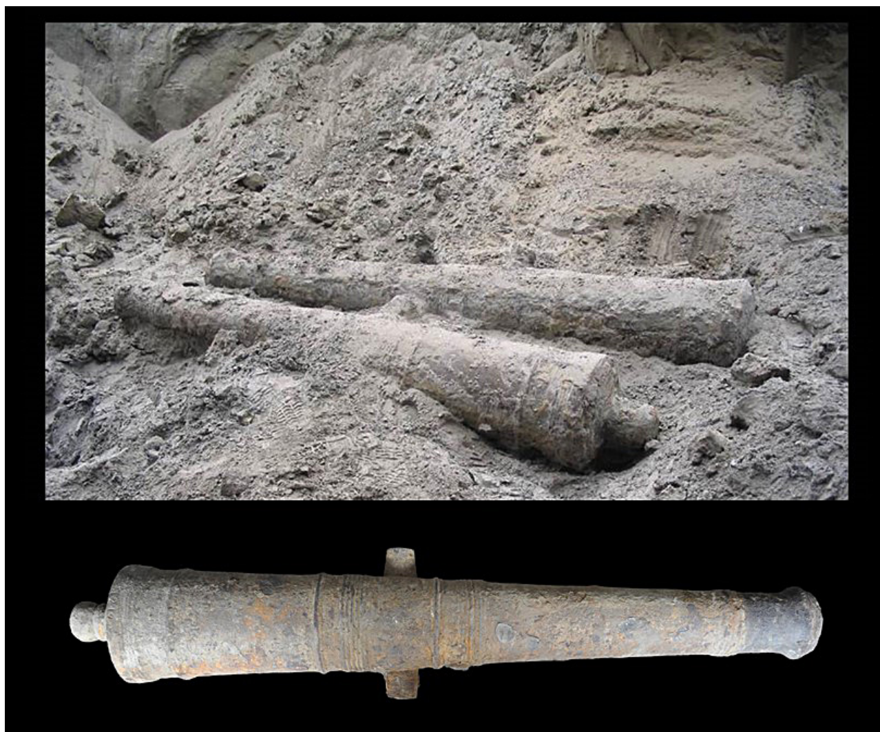
Figura 7. Cañones suecos cargados en bodega y cañón limpio (Fotografías Javier García Cano).

Un vestigio único entre los objetos recuperados del pecio de Zencity ha merecido un especial interés, es una pequeña madera tallada encontrada en la sección de la carlinga del palo mayor. Esta presenta una serie de dibujos de embarcaciones cuyo significado o intención desconocemos. Han hecho pensar en la posibilidad de alguna ofrenda votiva con motivos rituales por parte de los tripulantes para arribar a tierra al final de su viaje. Esta es una posible interpretación dado que salir a la mar era siempre una aventura peligrosa y las tradiciones marineras de todas las épocas así lo demuestran. Las supersticiones, las creencias, los