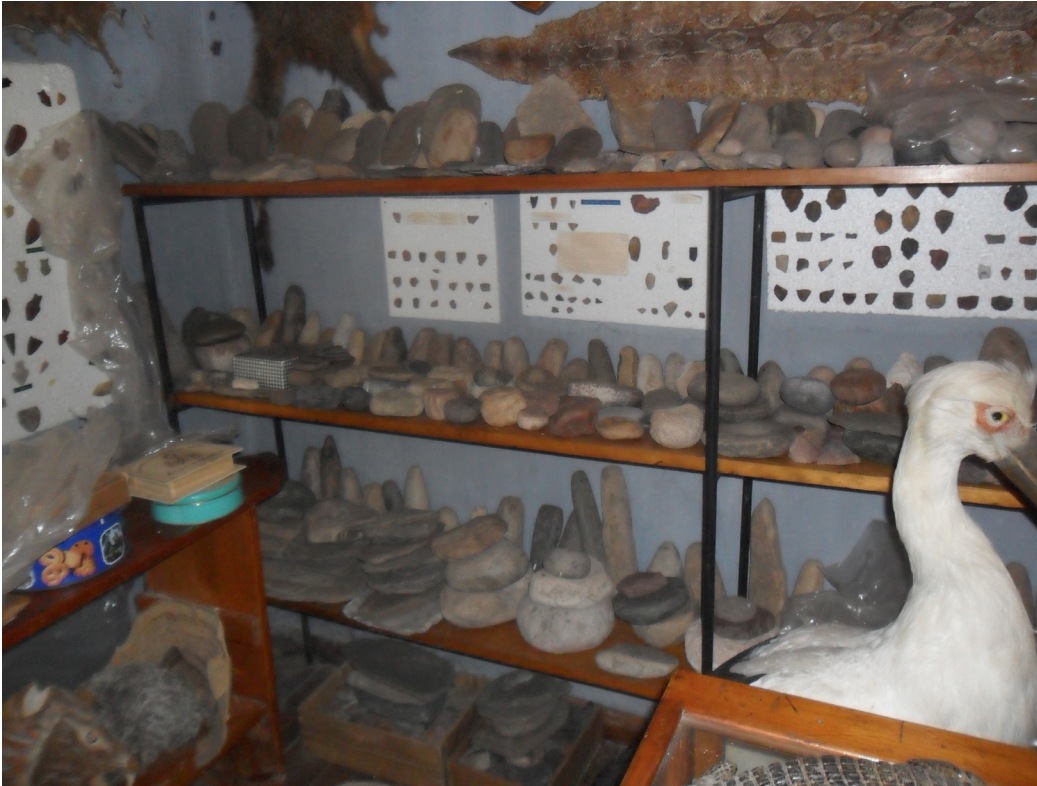
Figura 3. Piezas de la colección Cinquini.