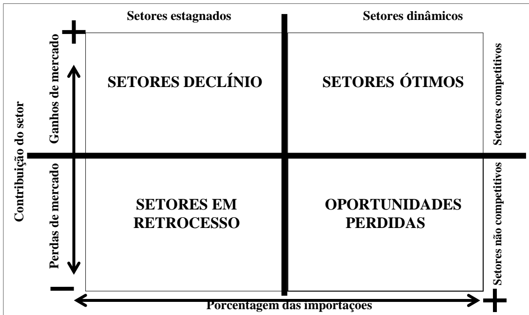
Figura 1 - Matriz de competitividade