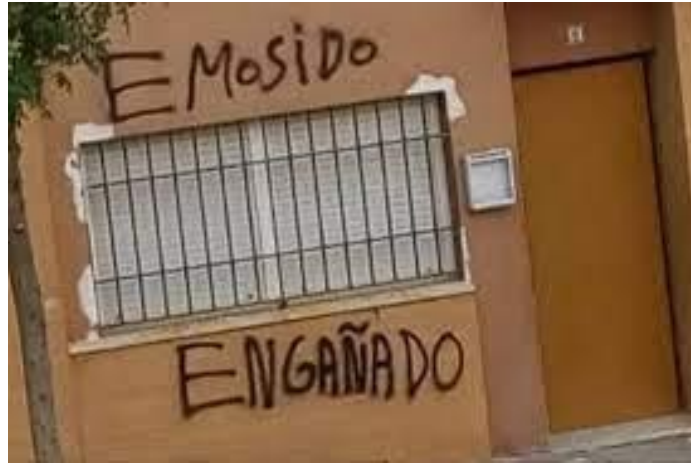
IMAGEN 2 EMOSIDO ENGAÑADO

estas tierras es el de la canción Aurora , cuya letra dice en una parte azul un ala y todos escuchamos a zuluNAla , e imaginamos que es otro prócer ( a Zulunala ) o una de las tantas palabras que desconocemos de esas letras de otros tiempos. Ejemplos de este tipo florecen por todos lados. Hay uno que se hizo viral y hasta se pueden encontrar remeras con esa frase: el bellissimo emosido engañado ( emoSido engaÑAdo ).