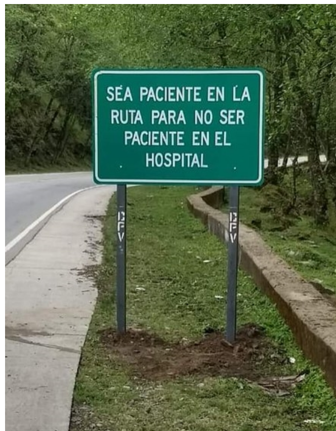
IMAGEN 1 Cartel: Sea paciente en la ruta para no ser paciente en el hospital