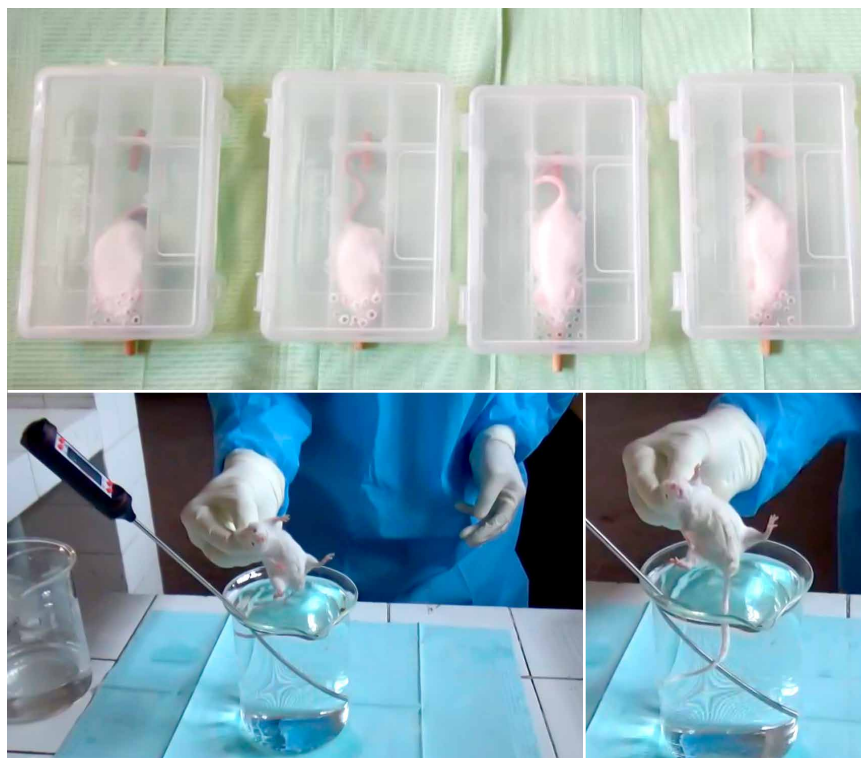
Figura 1. Procedimientos de Inducción de estrés, estímulo masticatorio y dolor nociceptivo somático en los ratones Balb/c. A: Animales sometidos a estrés por restricción y con las varillas de madera para estimular la masticación. B: Implementos empleados en la evaluación del dolor. C: Primer plano de la cola del animal sumergido en el agua temperada.

1 °C), según el procedimiento de Aguirre-Siancas et al . (25) . La evaluación fue realizada en los 5 grupos experimentales, el día 7 y 14 de iniciado el experimento, como se observa en la figura 1B y 1C. Se contabilizó el tiempo que cada ratón demoró en retirar su cola de la fuente de agua temperada, menores tiempos se relacionan con una mayor percepción y, a la vez, menor umbral al estímulo nociceptivo.