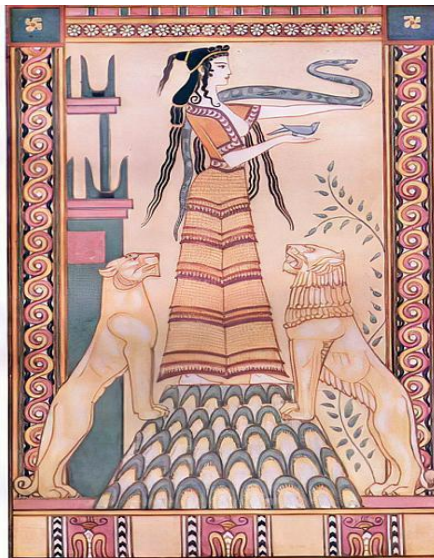
Imagen 1. Duncan, J. (1917). The Snake Goddess of Crete . [Ilustración]. Imagen obtenida en (Mackenzie, 1917).

Tercero: Proponer la reinterpretación creativa de los mitos, como ya hicieron, por ejemplo, muchas artistas vinculadas al movimiento feminista de la Segunda Ola en la década de los setenta del pasado siglo, para la deconstrucción del paradigma dual que determina las relaciones entre las personas y como aporte a la espiritualidad feminista.