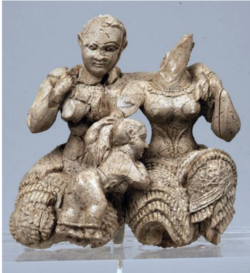
Imagen 8: Triada de marfil , 1500-1400 AEC. Península del Peloponeso (Grecia).