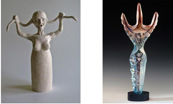
Imagen 11. Izquierda: Takacs, E. (2013). Contemporary Version Of The Snake Goddess Of Knossos . [Papel maché]. https://www.erikatakacs.com Derecha: Gott, S. (2016). Minoan Goddess . [Vidrio]. https://gottglass.com