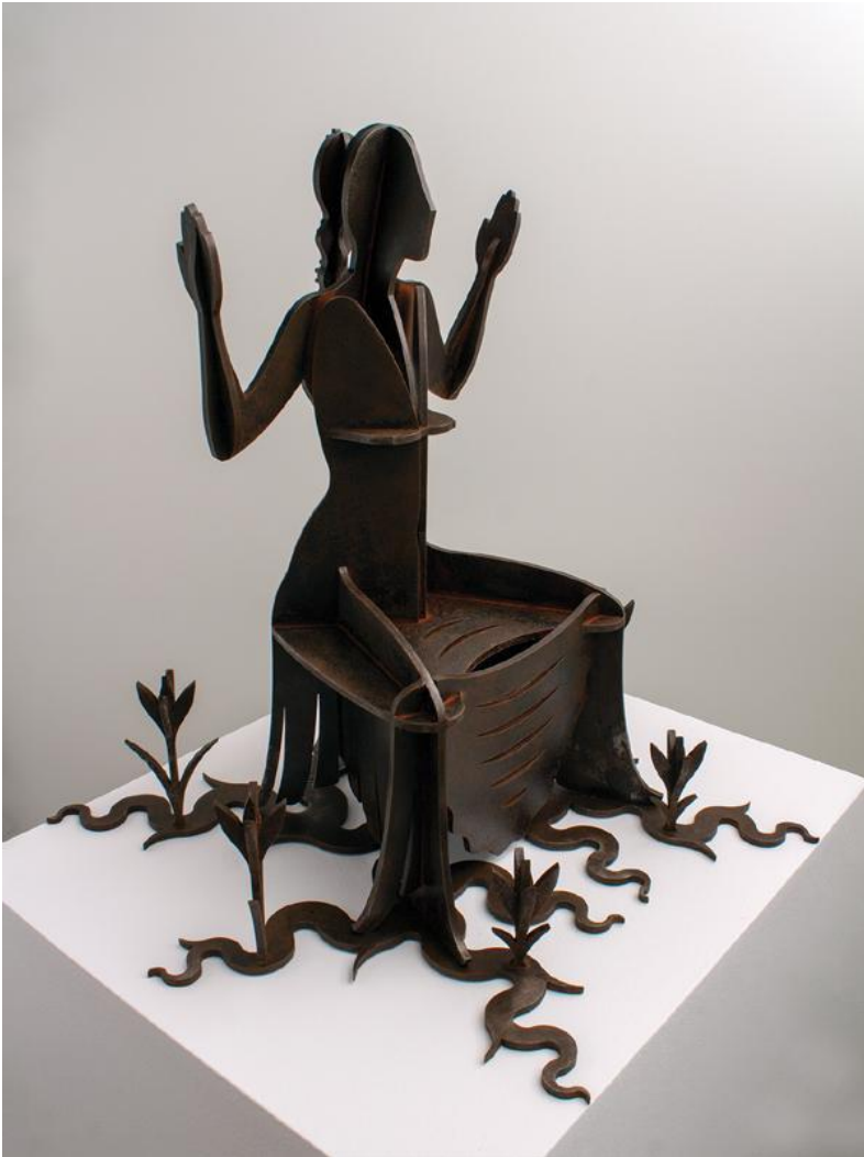
Imagen 10. Morro Mas, A. M. (2021). Epifanía . Acero.