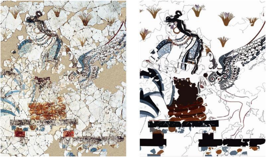
Imagen 9. Fragmento del fresco conocido como Gran Diosa , c. 1500 AEC, Santorini (Grecia). Izquierda: estado actual de conservación del fresco. Derecha: reconstrucción según M. Kriga. Ambas imágenes de ( Vlachopoulos, 2015 ).

Sentada en un altar, espléndida y luminosa, esta figura lleva pendientes y colgantes con formas de ánades y de libélulas, y una flor de azafrán tatuada en la mejilla. A un lado, un mono azul le ofrece estigmas de esta flor, y un grifo la flanquea por el otro. Cuatro mujeres más aparecen en diversas etapas de la recolección del azafrán ( Field, 2007 ; Nugent, 2008 ). Aunque en general, las distintas interpretaciones del programa pictórico de Xeste 3 han pivotado en torno a la religión, Field propone una lectura alternativa de la naturaleza de las figuras femeninas representadas en sus frescos. El azafrán fue venerado como recurso multifuncional arraigado a muchas facetas de esta sociedad: como especia, como tinte amarillo para las telas y como componente en la fabricación de perfumes, logrando una gran importancia económica. Además, sus aplicaciones analgésicas -para cólicos menstruales o durante el parto- y abortivas -la crocina, un carotenoide natural que se encuentra en el azafrán, es muy similar químicamente a los abortivos actuales- lo habrían convertido en