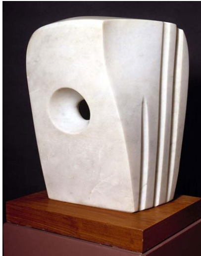
Imagen 2. Hepworth, B. (1972). Minoan Head . [Mármol y madera]. https://fitzmuseum.cam.ac.uk/objects-and-artworks/highlights/M11-2000

La cultura minoica, desarrollada principalmente en Creta en la Edad del Bronce egea, ha ejercido, y ejerce, una gran fascinación desde su descubrimiento, a principios del siglo XX. Su legado más importante, según Momigliano, reside no sólo en los restos arqueológicos del tercer y segundo milenio AEC, sino también en las capas acumuladas de respuestas e interpretaciones de esta cultura material, espejo de los anhelos y aspiraciones de diferentes épocas (2020). Así, si en un primer momento sus representaciones sinuosas encajaron en el contexto modernista de la Belle Époque (Hsu, 2017) (Imagen 1), su asociación con la feminidad, con un mundo pacífico e igualitario y en sintonía con la naturaleza, siguió inspirando a multitud de artistas de distintos ámbitos en las sucesivas vanguardias posteriores (Imagen 2).