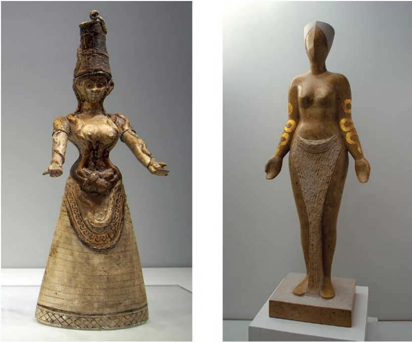
Imagen 6. Izquierda: Diosa serpiente , c. 1600 AEC. [Cerámica]. Creta (Grecia). http://www.arthistoryproject.com/ . Derecha: Morro Mas, A. M. (2021). La recolectora de azafrán . Piedra y pan de oro. Fotografía del autor.

Así mismo, Kopaka sugiere la posibilidad de que, en las creencias cosmológicas de la época, las personas, junto con algunos animales, plantas y elementos inanimados, formasen grupos de linajes totémicos (2009); y Crooks, Tully y Hitchcock, proponen el término “ontología animista” para referirse a una comprensión del mundo material como algo que vive y siente, más allá de la dicotomía natural/sobrenatural. Desde esta perspectiva, el culto minoico a las piedras y a los árboles no implica reverencia alguna a seres divinos, sino que puede interpretarse como “ events in which humans