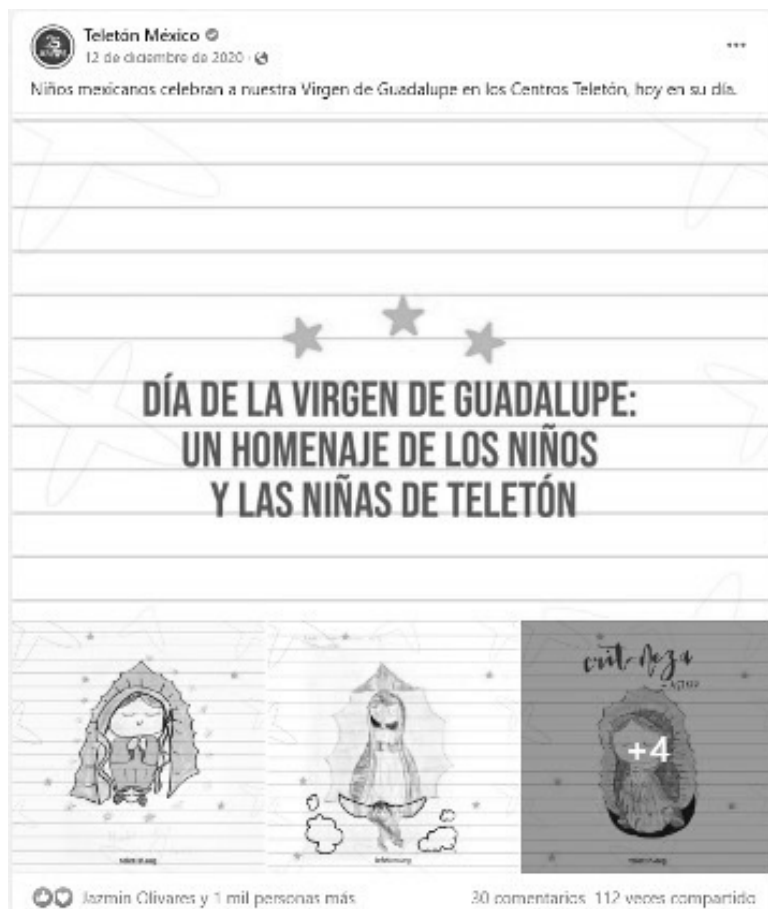
Imagen 6. Día de la virgen en Teletón