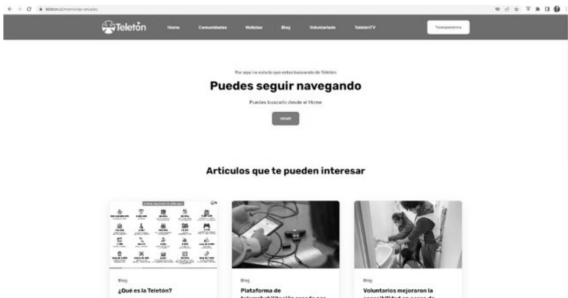
Imagen 3. Página que aparecía al entrar a las Memorias Anuales por enlace, ahora inactivo

Fuente https://www.teleton.cl/transparencia