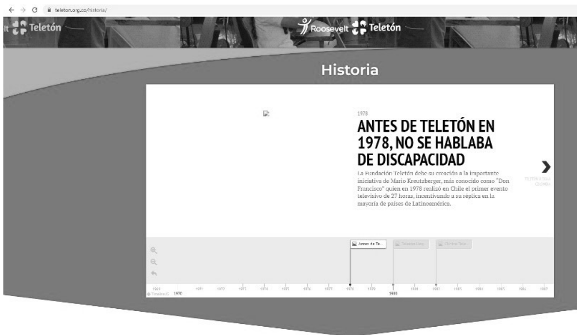
Imagen 1. Página que da muestra de la primera TELETÓN en América Latina, celebrada en Chile, 1978