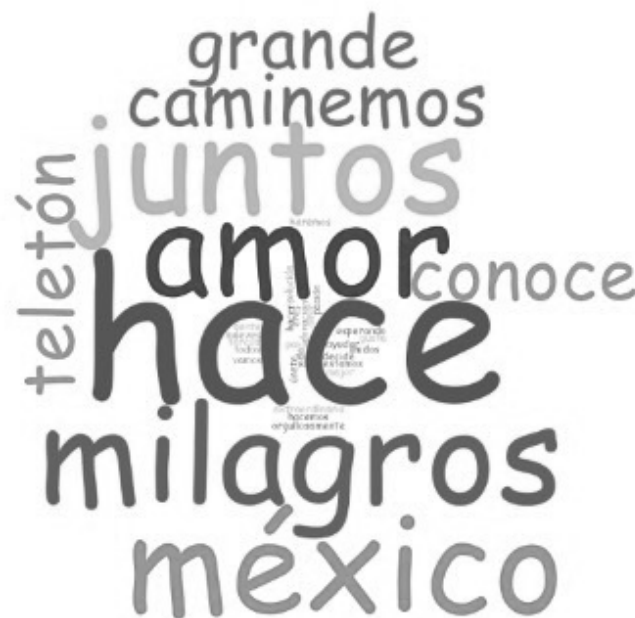
Imagen 8. Frecuencia de palabras en slogans del Teletón México

En el caso de México los slogans a lo largo del tiempo han sido: Juntos haremos el milagro (1997), El amor hace milagros (1998 y 1999), Vamos a dar (2000), Te estamos esperando (2001), Un paso más (2002), Lo hacemos todos (2003), Unidos por el amor (2004), Ayudar es amar (2005), El amor hace milagros (2006), El teletón eres tú (2007), El teletón lo haces tú (2008), No hay imposibles (2009), Lo mejor de ti hace grande a México (2010), Caminemos juntos (2011), Gracias a ti (2012), Gente extraordinaria (2013), Pasión por la vida (2014) 38 , Ven, conoce y decide (2015); Ven conoce y únete, tu donación es la solución (2016), México de pie (2017 y 2018), ¿A ti qué te gusta hacer? (2018), Nos mueves tú (2019). Orgullosamente tercos (2021). 39