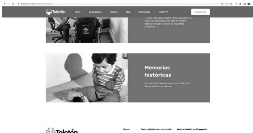
Imagen 2. Página de Teletón Chile donde la opción de “Memorias históricas” no puede activarse