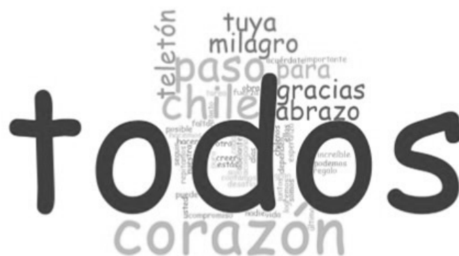
Imagen 7. Frecuencia de palabras en slogans del Teletón Chile

Para creer en la vida (1987), Es tarea de todos (1988), Nadie puede faltar (1990), Gracias a usted (1991), Hay tanto por hacer (1992), El compromiso de Chile (1994), Nuestra gran obra (1995), Otro paso adelante (1996), Todos contamos (1998), Un desafío para los chilenos (2000), La Teletón es tuya (2002), La Teletón es tuya, ¡acuérdate! (2003), Ellos dependen de ti (2004), Con todo el corazón (2006), En cada paso estás tú (2007); Gracias a ti, podemos seguir (2008); Chile, un solo corazón (2010); Con la fuerza del corazón (2011), Puro corazón (2012), Somos todos (2014), La hacemos todos (2015), El abrazo de Chile (2016), El abrazo de todos (2017), El regalo de todos (2018), Te acompaña (2020), Todos los días (2021) 37