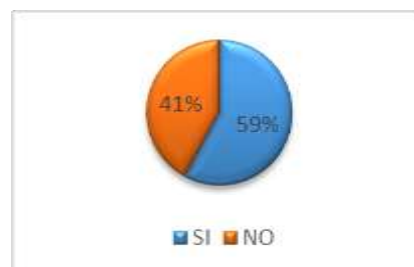
GRÁFICO No 3