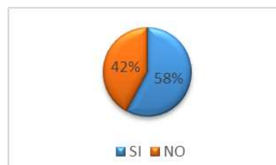
GRÁFICO No 5