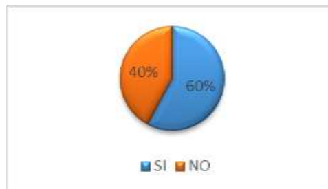
GRÁFICO No 4