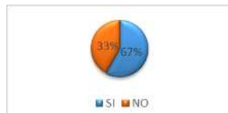
GRÁFICO No 1