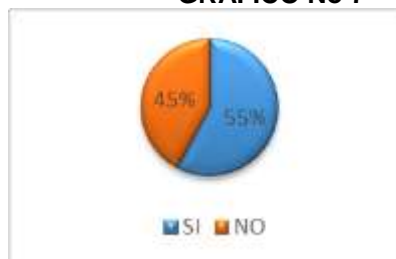
GRÁFICO No 7