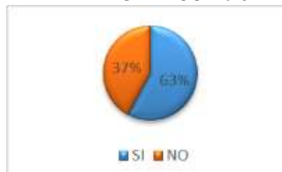
GRÁFICO No 6