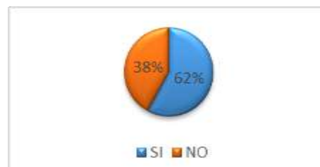
GRÁFICO No 2