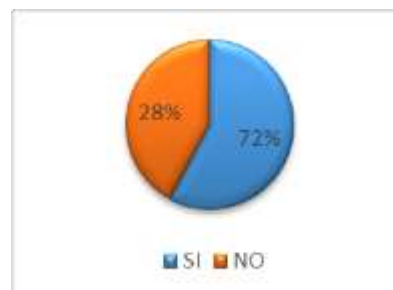
GRÁFICO No 8