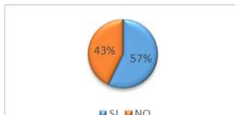
GRÁFICO No 10