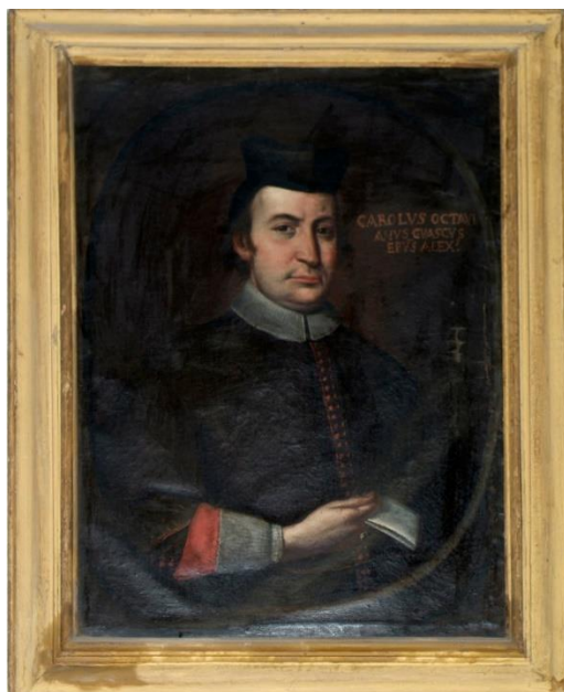
Catedral de Alejandría (catalogo generale dei beni culturale).

Figura 4. Retrato de Carlo Ottaviano Guasco (pintado en el periodo que fue obispo de Alejandría)