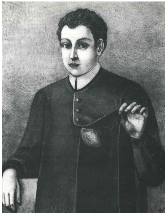
Placchi, 1989: p. 125.

Figura 2. Retrato al carbón que publicó Primo Lanzi, cuya autoría Placchi se la otorga a L. Maglia en 1911 y que manifiesta encontrarse en la sacristía de la iglesia parroquial de Casalmorano