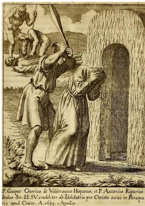
Tanner, 1675: p. 505.

Figura 1. El martirio de los Padres Ososio y Ripari, ilustración del artista Karel Skreta (1610-1675) y el grabador Melchior Küsel (1626-1683)