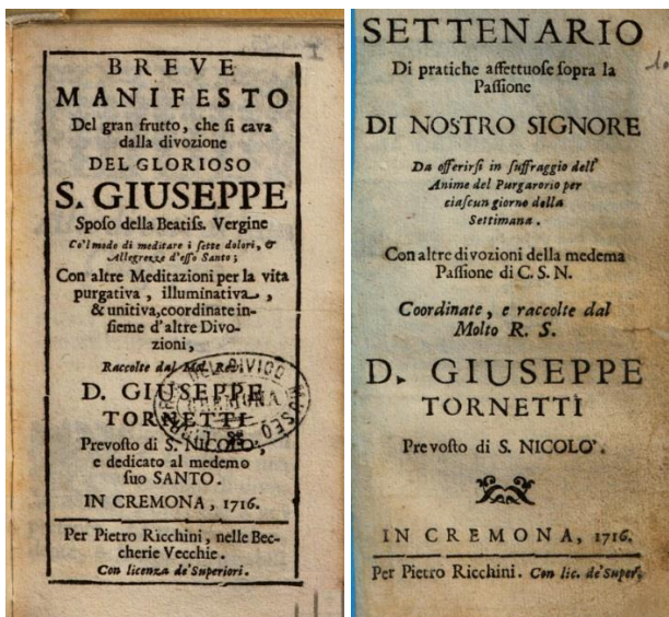
Figuras 3. Portadas de dos de los libros de Tornetti y la reedición del de Merula