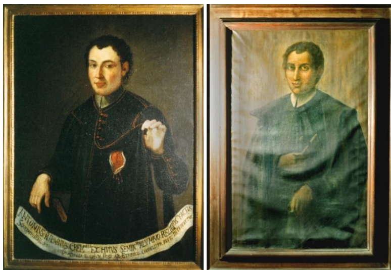
Biblioteca del Seminario Vescovile di Cremona.

Figuras 5. Conocemos varios retratos, ubicados en diferentes sitios Incluso un vitral colocado en 1963 en la iglesia de Casalmorano. Estas dos fotografías nos enviaron las bibliotecarias del seminario, pero son pinturas que no las tenían ubicadas. No se conocen los autores. Los dos los publica Placchi, aunque el primero sin marco y el segundo recortado y en blanco y negro