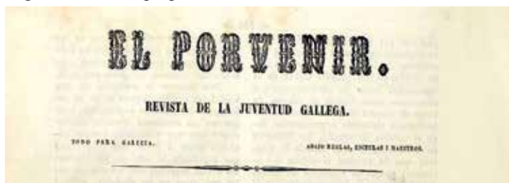
Cabezallo de El Porvenir do 2 de agosto de 1845.

Será neste ambiente onde tome contacto co xornalismo, coa colaboración na publicación desa Academia Literaria, El Idólatra de Galicia . De alí salta logo a El Recreo Compostelano , saíndo así á luz, se antes non o fixera en círculos máis íntimos, esa prosa con «alma de lume» de Antolín Faraldo, que irá pulindo conceptos e matizando o seu ideario ao longo de cabeceiras e unha presa de anos e vivencias. Despois pasará a La Situación de Galicia onde xa reflexiona sobre Galiza e os seus problemas e vai pulindo o ideario progresista e galeguista e remata en El Porvenir , onde baixo a divisa “Todo por Galicia” remata xa de definir o proxecto político nidiamente galego e democrático, a Grande Obra. O xornal será pechado por orde gubernativa ao espallar «doctrinas sediciosas» segundo recolle a propia orde de censura.