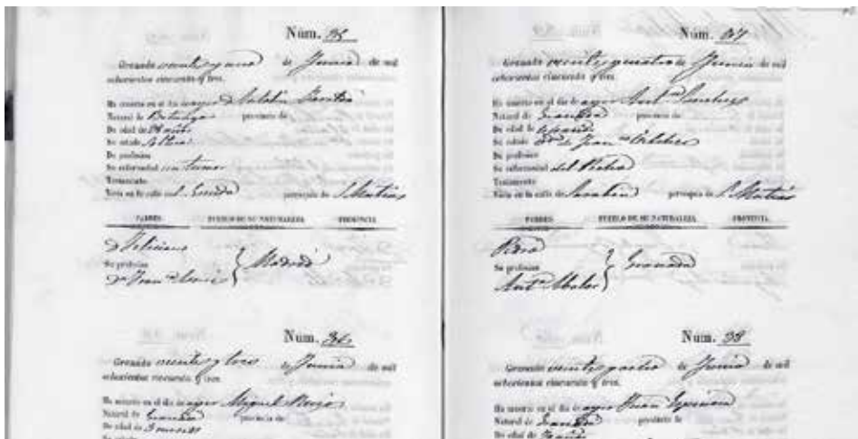
Asento rexistral do falecemento de Antolín Faraldo no libro do Rexistro civil custodiado no arquivo municipal de Granada, segundo cal tería sido veciño da rúa do “Escudo” da parroquia de San Matías (tal vez a actual rúa do Escudo del Carmen, apenas a uns metros da igrexa parroquial de San Matías) e finado dun “tumor” o 21 de xuño de 1853 aos “28” anos. A reseña anota que era natural de Betanzos, mais tamén indica, tal vez por chegar a Granda desde alí, que a vila da súa natureza era Madrid.

«Así caeu o primeiro e o mellor, lonxe do seu país, na indiferenza e o esquecemento dos seus» dicía Murguía. Hoxe sabemos, porén, que esa prohibición governativa para volver a Galiza non impediu que seguira a participar de actos a prol do país, nunha colecta para facer fronte á fame que mataba a centos de compatriotas e forzaba a emigración de milleiros no ano da fame, 1852-53 6 . No entanto, Faraldo non cesa tampouco de buscar a súa rehabilitación política e moral por parte da facción progresista, e participa en actos de apoio ao xeneral Espartero e mesmo entrevistábase persoalmente con el. Mais non o logrará: falece en Granada (Vales, 1957) o 20 de xuño de 1853. O «fugaz meteoro» tiña 30 anos.