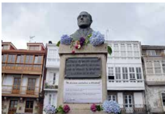
Monumento a Antolín Faraldo, ao pé da Ponte Vella de Betanzos.

Esta placa, de bronce, foi instalada na sede do Centro Betanzos nunha homenaxe aos Mártires da Liberdade celebrada o sábado 29 de abril de 1951, no seu 104 cabodano. Esculpida por Domingo Maza, contaba cunha Liberdade e a lenda “Carral. Galiza mantén alcendida a idea procamada polo esgrevio betanceiro ANTOLÍN FARALDO mentras custodia a gaita que ten que tocar o hino da súa liberdade. Homenaxe das sociedades betanceiras aos Mártires de Carral”. Trátase do primeiro monumento de homenaxe a Antolín Faraldo. Perdeuse en 1989 co cambio á actual sede do Centro Betanzos. Foi publicada en Betanzos: Publicación oficial del “Centro Cultural Betanzos” y portavoz de la Colonia Brigantina , nº 45, ano XLV, 1951.