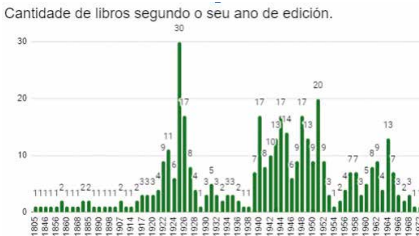
Fig. 4. Gráfico que mostra o número de libros segundo o seu ano de publicación.

Do catálogo realizado podemos sacar os seguintes datos en claro: