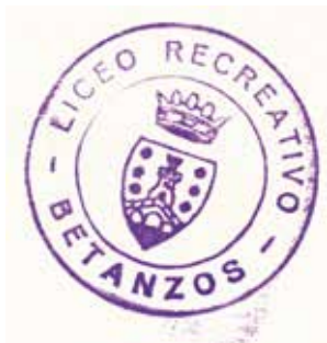
Fig. 1. Un dos selos que funcionaban como ex libris da sociedade.