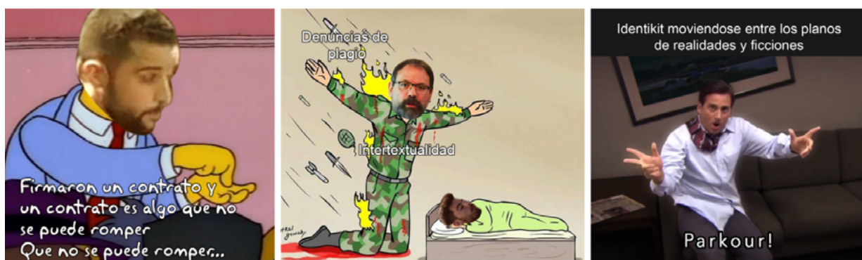
Imagen 6: Pisano, T. S., Tavip, V. (Coords.) (2022). Identikit.Museo . Memes realizados por I. Boscoboinik para el instagram de Identikit.Show . Córdoba, Argentina.

Como se puede constatar, cada integrante resolvió su intervención proponiendo otros sentidos a partir de la manipulación de registros, generando un contenido altamente heterogéneo en la red social. Asimismo, las distintas propuestas creativas se vincularon con los conceptos expuestos en los primeros encuentros: intertextualidad, intersemiosis, veridicción y contrapunto cognitivo.