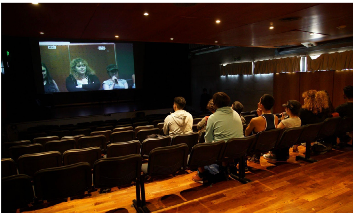
Imagen 3: Pisano, T. S., Tavip, V. (Coords.) (2022). Identikit.Museo . Córdoba, Argentina.

En tercer lugar, se presentó una performer con la cara reemplazada por un video de emojis que veía un registro intervenido y distorsionado de la ópera Identikit.Show . Esta persona, poco a poco, cambiaba sus estados de humor, interactuando de diversas maneras con el público. Asimismo, al frente de esta escena, se encontraban auriculares disponibles para ser utilizados. Lo que se oía eran músicas originales referenciadas en la ópera original. Esta instancia fue probablemente la más compleja en cuanto a cantidad y variedad de estímulos.