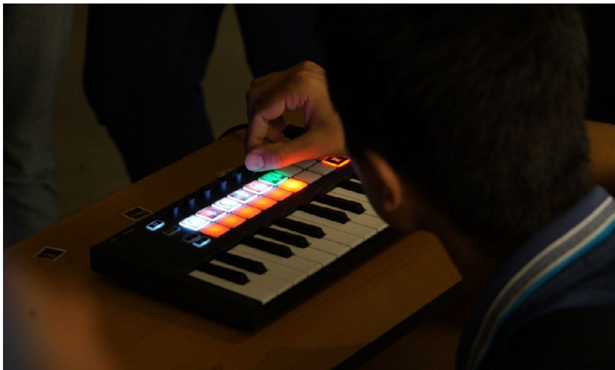
Imagen 2: Pisano, T. S., Tavip, V. (Coords.) (2022). Identikit.Museo . Córdoba, Argentina.

En la segunda, en el Auditorio, una voz en off entrevistaba a personas del público. Quien era entrevistado/a sabía que estaba designado/a porque en la pared del escenario se proyectaba su cara. Asimismo, un asistente le acercaba un micrófono para que todo el público vea y escuche sus respuestas. Las preguntas eran de diversa índole: algunas más incómodas (similares a las de la ópera) y otras más relajadas sin mucho desarrollo/importancia.