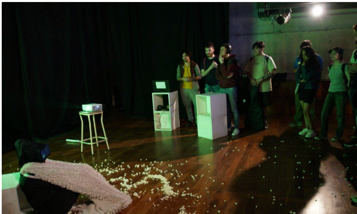
Imagen 4: Pisano, T. S., Tavip, V. (Coords.) (2022). Identikit.Museo . Córdoba, Argentina.