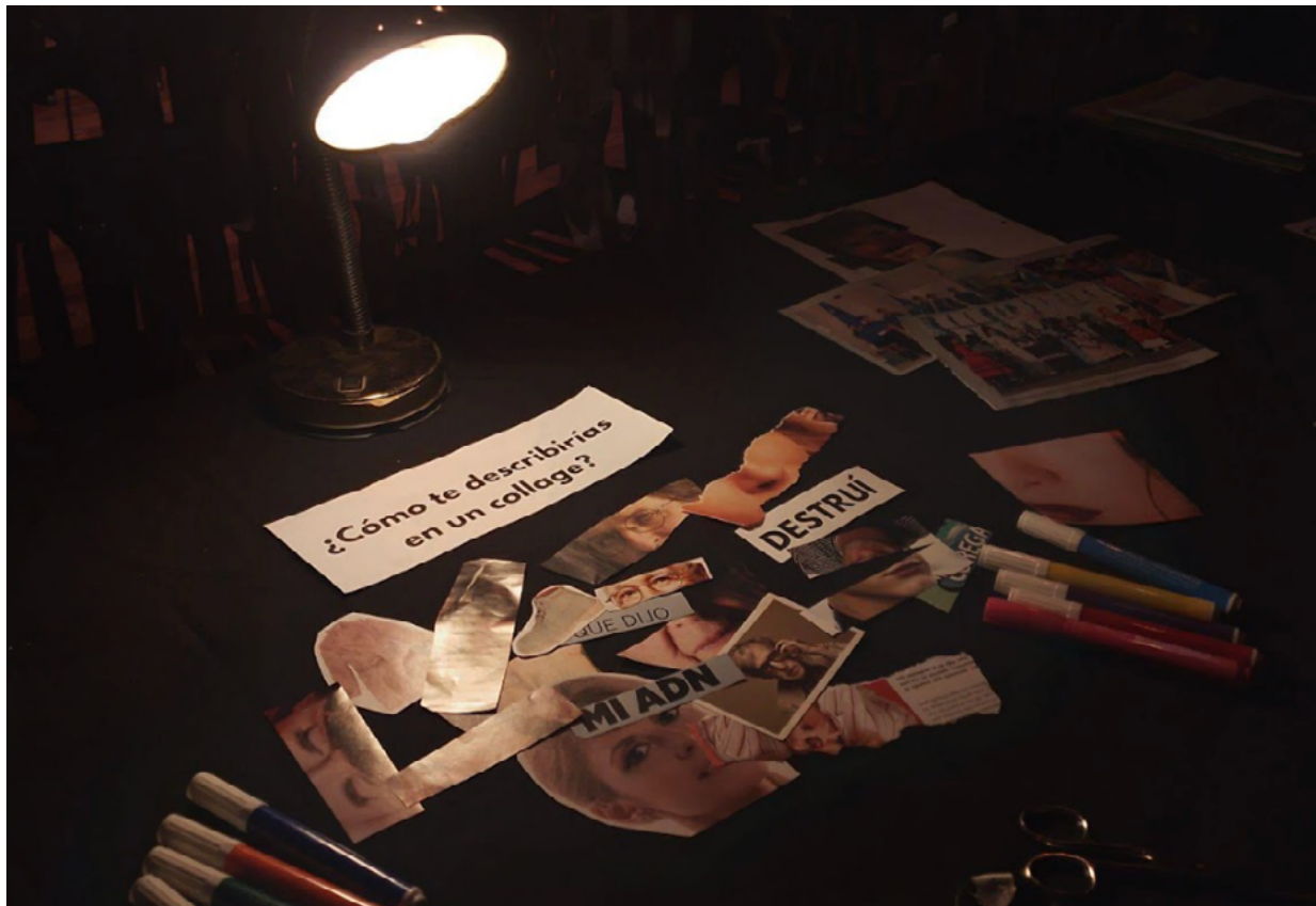
Imagen 5: Pisano, T. S., Tavip, V. (Coords.) (2022). Identikit.Museo . Córdoba, Argentina.