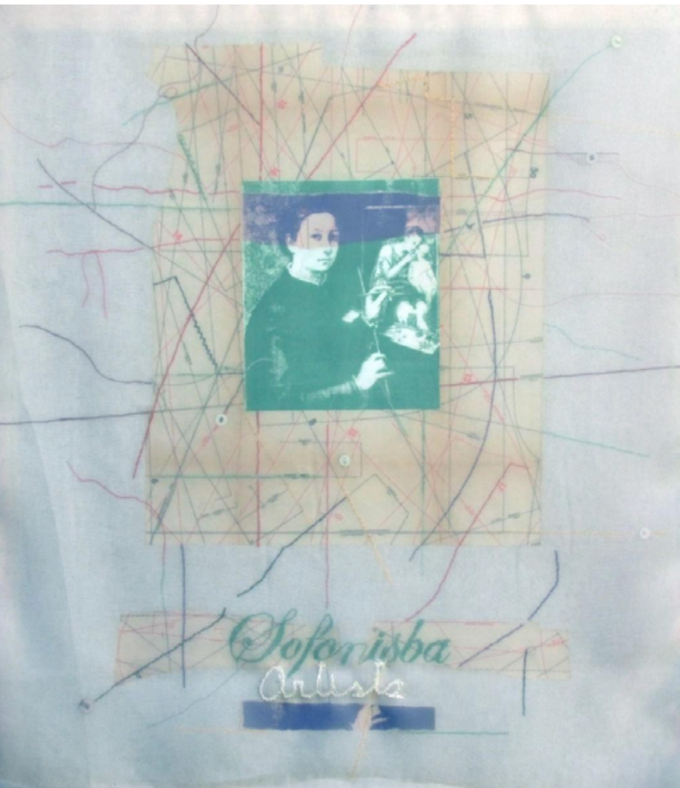
Imagen 3: Brunotti, A. (2018-19). Develar [litografía y bordado sobre papel, liencillo y voile]. Serie Labores feministas . 70 x 90 cm.

una afirmación: “Sofonisba artista.” Entre el sintagma y el retrato hay una distancia física y la Sofonisba visual queda atrapada en una telaraña de costuras sin sentido aparente que se superpone a otra, hecha de líneas de puntos e instrucciones en moldes prearmados de corte y confección. El soporte resulta grande y en ese encuadre Sofonisba empequeñece bajo una veladura de voile , lejana y rasgada.