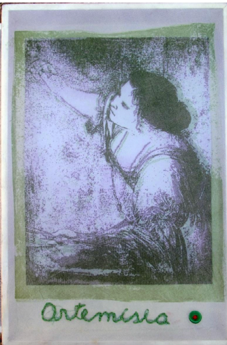
Imagen 2: Brunotti, A. (2019a). Artemisia [litografía y bordado sobre papel y voile]. 20 x 40 cm.

rini (2021) define como perspectiva aditiva) y lo extrapola más allá de sus límites disciplinares; lo lleva a un punto de tensión y, desde la práctica artística, inscribe una marca en la historia del arte, cuya tradición es extrañada y su libro/objeto referente, desbordado, aunque persistente.