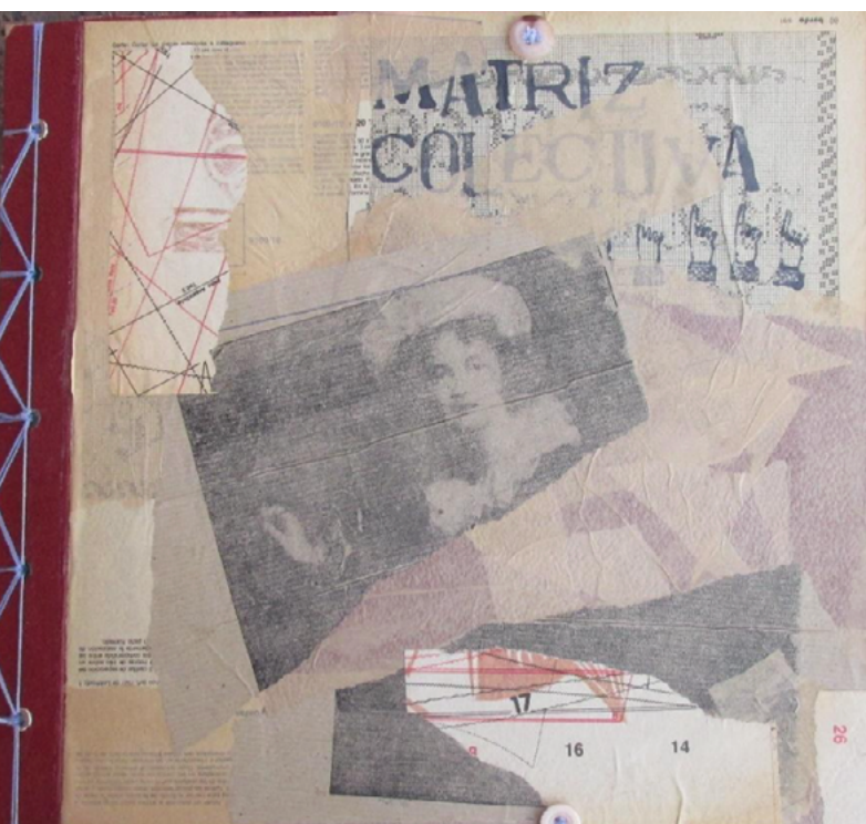
Imagen 6: Brunotti, A. (2021). Ausentes por omisión (homenaje a María Gimeno) . Libro de artista (portada).

para las copias y órgano femenino donde se desarrolla el feto. En la tapa del libro hay un collage de imágenes rotas, con una sola frase que, por su ubicación, bien podría ser el título: matriz colectiva (es, además, el nombre de un colectivo de artistas del que Brunotti forma parte). En lugar de La historia del arte , con su relato lineal de figuras masculinas y excepcionales, es una matriz colectiva.