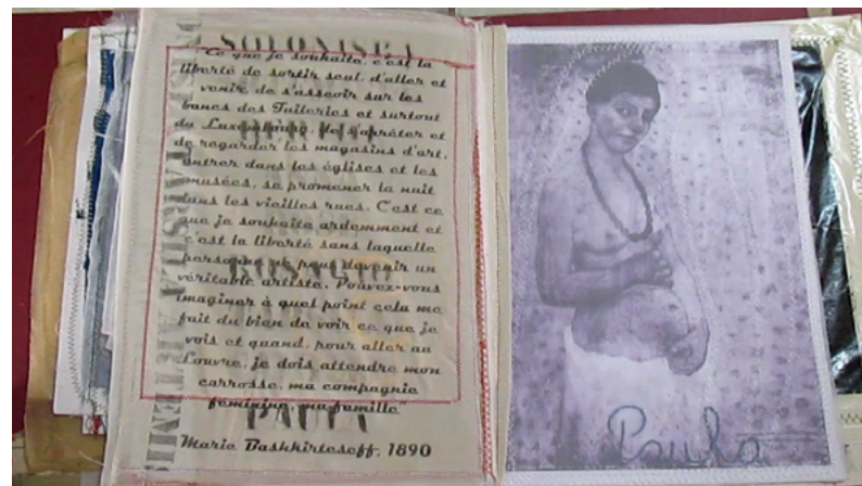
Imagen 5: Brunotti, A. (2021). Ausentes por omisión (homenaje a María Gimeno) [libro de artista].

se traman los nombres de artistas del pasado propone un encadenamiento que no solo interroga ese pasado, sino también la pervivencia de la desigualdad y opresión de la mujer aún hoy . Aunque no lo hace de manera directa, el texto está en francés y no terminan de verse las palabras. Tal vez, haya que recorrer la sala y encontrar la otra pieza para darle sentido.