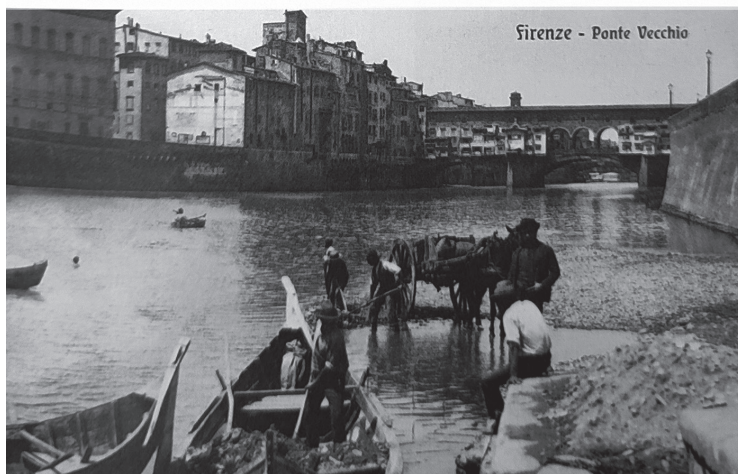
Fig. 4. Las riberas del Arno pobladas por los renaioli . Fuente: Petrioli y Petrioli 2020, 25. Crédito fotográfico: Archivos Alinari, Florencia - cortesía de la Fondazione Alinari per la Fotografia.

Giuseppe Zocchi de 1744 (Fig. 2) y unos calotipos, realizados por John Brampton Philpot algunas decenas de años después del aluvión de 1844 (Fig. 3), nos enseñan una ciudad que ha vuelto a hacer las paces con su río, cuyas riberas están pobladas por sus habitantes en sus quehaceres cotidianos. Los renaioli 12 (Fig. 4), las lavanderas (Figs. 5 y 6), los pescadores, consiguieron desarrollar cierta resiliencia frente a la idea burguesa de decoro urbano en la que se inscribirían los planes de Poggi, que