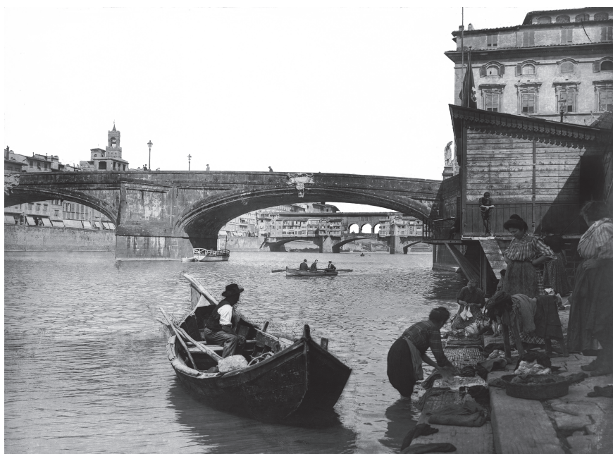
Fig. 6 El Arno visto desde el puente Santa Trinita; en primer plano, las lavanderas. 1900 - Fotógrafo: Mannelli, Anchise & C. - Fecha de la captura: 1900 ca. - Crédito fotográfico obligatorio: Archivi Alinari, Florencia - Collezione: Archivi Alinari-archivo Mannelli, Florencia. MAA-F-01355A-0000.