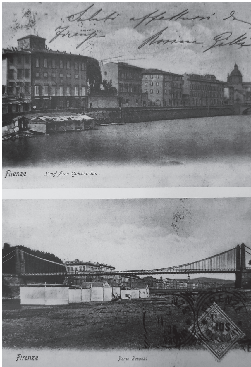
Fig. 1. Vista de las playas del río Arno cerca del Lungarno Guicciardini y de la zona del puente de Le Cascine : se señala la presencia de las cabañas y casetas temporáneas e informales de los baños.