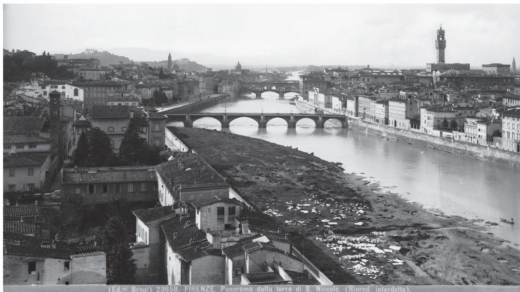
Fig. 5. Vista panorámica de Florencia desde la torre San Niccolò. Se señala la presencia de ropa tendida a secar en la ribera del río Arno, – Fecha de la captura: 1920-1930 ca.