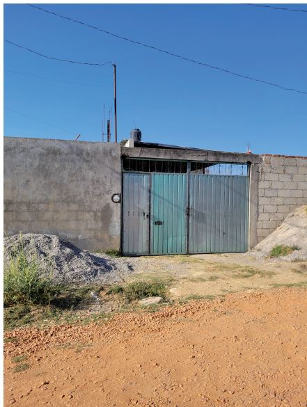
Fig. 2. Fachada de autoconstrucción en zona de estudio. Fotografía de la autora, marzo 2022.