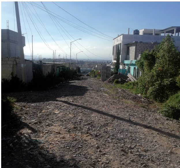
Fig. 3. Calle de la zona de estudio. Fotografías de la autora, noviembre de 2021.

que los materiales pueden no contar con la calidad suficiente, o bien, la arquitectura carece de los estudios pertinentes para validar su seguridad. Esto se relaciona con falta de información o bien de recursos económicos para adquirir materiales de mejor calidad. Sin embargo, estos espacios también representan trabajo acumulado de la población, que ha construido con dinero y esfuerzo la vivienda y el espacio que le rodea, por lo que simbolizan un lugar de identidad y orgullo. Asimismo, representan una manera de identificar las viviendas funcionales para las familias que habitan la zona, quienes van adaptando el espacio, dando relevancia a ciertos elementos o al crecimiento de las personas que habitan las viviendas.