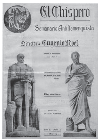
Figs. n.ºs 1 y 2.- Portadas de El Flamenco y El Chispero .

el ídolo, en la estampita milagrera». El nuevo lenguaje de Noel parece en entredicho. El futuro Nobel cree que la mercancía de la imagen no es la vía del combate cultural.