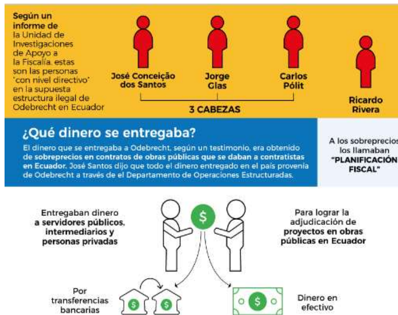
Figura 2 Planificación Fiscal por parte de Odebrecht en Proyectos(" Diario El Universo", 2017).

Jorge Glas Ministro Coordinador de los Sectores Estratégicos negó que los contratos adjudicados a la empresa constructora Odebrecht fueran con sobornos y sobrepagos conocidos también como Planificación Fiscal, Glas aseguraba que los precios ofertados por la empresa Odebrecht eran lo mejor para el beneficio de todo el pueblo ecuatoriano. Jorge Glas declaró que el escándalo hacia la empresa Odebrecht era una trasgresión al Art.49 de la ley de Contratación Pública aprobada en julio del 2008 en el cual se indica que procedimiento se debían seguir para licitar obras públicas.