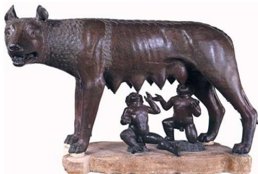
Figura 1. La Loba Capitolina o luperca amamantando a Rómulo y Remo. Museos Capitolinos. Fuente

Esta teoría es propuesta por el arqueólogo Johann Joachim Winckelmann en el siglo XVIII. Su planteamiento dataría a la escultura como obra del siglo V a.C., correspondiendo al arte etrusco. Fuentes como Cicerón, Plinio el Viejo y Tito Livio ya habían expuesto en sus tratados la existencia de una escultura en el foro romano, que representaría la fundación de Roma a través de una leyenda mitológica, pudiéndose referir a esta.