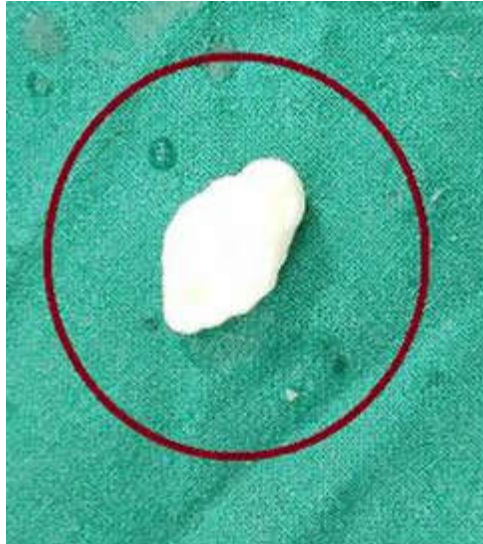
Fig. 3. Cuerpo articular libre extraído por vía artroscópica.

En caso de no poder extraer el CLA por la vía artroscópica se procede a la artrotomía. Si se sospecha la presencia del CLA en la bolsa suprapatelar es conveniente colocar la rodilla en extensión y en caso de estar postero-medial o lateral es mejor colocar la articulación en flexión. (12,13)