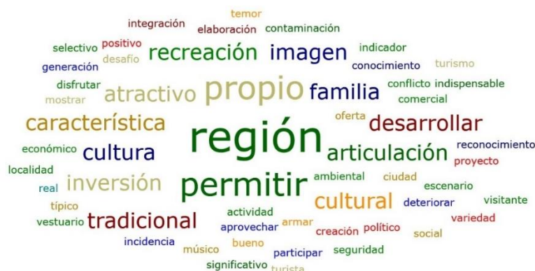
Figura 4. Mapa de palabras sobre los principales desafíos en la puesta en marcha de propuestas de recreación en ciudades intermedias

Al respecto la perspectiva de los expertos se enfoca en la relevancia de la articulación comercial para incidir positivamente en la creación de escenarios recreativos, así como el reconocimiento de las características propias de las localidades como elemento diferenciador, especialmente de sus sabres gastronómicos ancestrales. La figura 4. Recoge los elementos de mayor importancia acotados en los resultados de la variable.