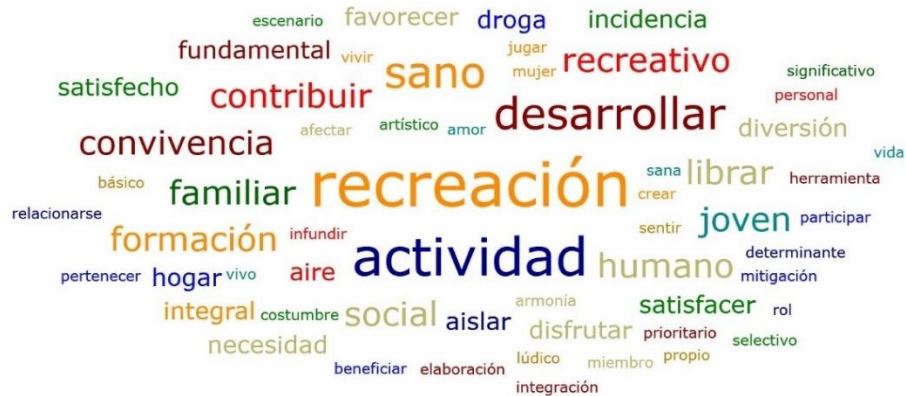
Figura 2. Nube de palabras relacionadas con la recreación en la sana convivencia familiar y el uso del tiempo libre

En este sentido, la recreación como herramienta para la sana convivencia familiar y buen uso del tiempo libre estuvo relacionado con la forma como es posible contribuir al desarrollo regional, dando respuesta a las necesidades del grupo primario, generando propuestas integrales, priorizadas según la perspectiva de los grupos de interés, conceptos prevaledidos en la figura 2.