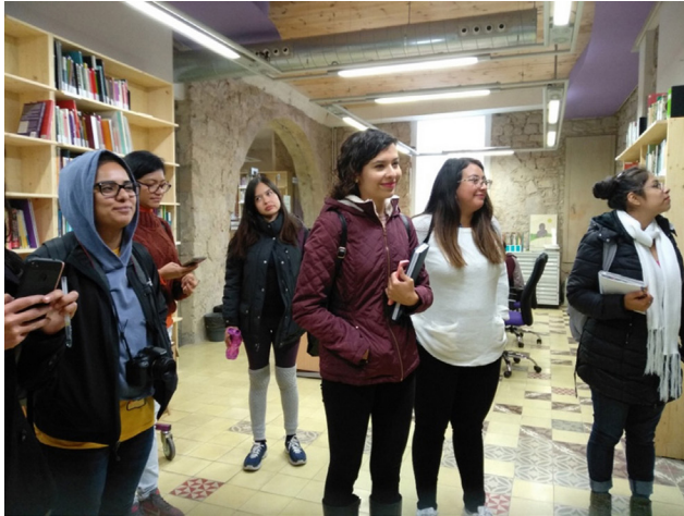
Figura 2. Visita organizada con las alumnas a Ca la Dona

desigualdades sociales y de género. Para ilustrar esta diferencia se realizaron recorridos, por ejemplo, se visitó Ca la Dona (Casa de la Mujer), que es un espacio autoorganizado producto de la lucha feminista formado por más de 20 colectivos. Visitamos su sede en el barrio Gótico de Barcelona, un edificio con parte de la muralla medieval y un yacimiento arqueológico. El proyecto es una buena práctica de rehabilitación patrimonial, un ejemplo de diseño con la participación directa de los grupos feministas.