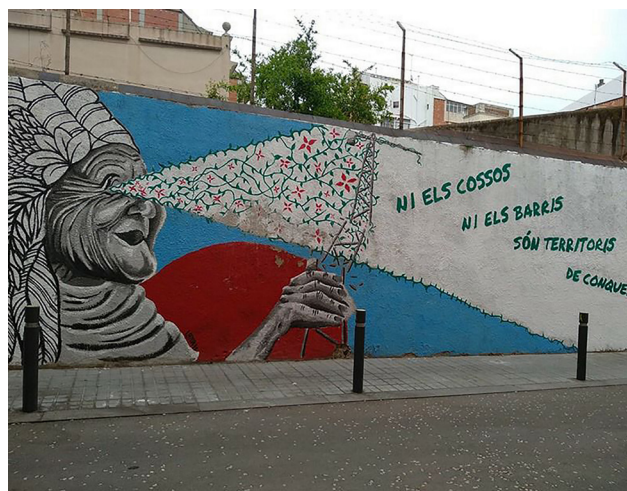
Figura 1. Ni los cuerpos ni los barrios son territorios de conquista

Rita Segato (Segato, 2013) indica que el mundo de hoy está marcado por la conquista y dueñidad de los territorios, donde podemos trazar genealogías de violencia cada vez más brutales que se representan en los territorios que son objeto de proyectos extractivos denominados de ‘desarrollo’ (Svampa, 2019), y en los cuerpos femeninos vulnerables al feminicidio vinculado a los enclaves de explotación. Como respuesta a esta violencia surgen innumerables luchas invisibilizadas desde el feminismo popular y el comunitario (Gargallo, 2014) en defensa del territorio.