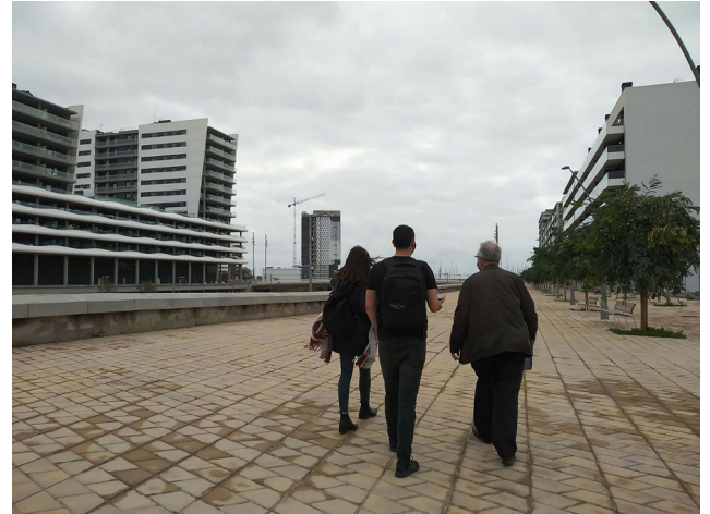
Figura 3. Recorrido por Badalona

públicos del resto de la ciudad de Badalona, como la piscina municipal, el mercado y la biblioteca, que actualmente están sin mantenimiento o cerrados por la falta de dinero. El canal no se ha terminado debido a los enormes problemas técnicos que presenta, ya que requiere la realización de un costoso viaducto para el paso del tren (Cucarella, 2021). En el recorrido también realizamos un encuentro con una vecina expropiada por el proyecto que nos explicó su lucha y las arbitrariedades que sufrió hasta ser reubicada.