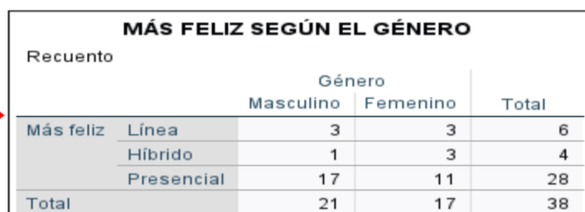
Tabla 3. Correlación estado de felicidad docente y género.