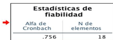
Tabla 1. Alfa de Cronbach

La metodología usada en este estudio se basó en la propuesta por Gil-Villa et al. (2020). En el estudio cuantitativo, el índice de confiabilidad usado para estimar la homogeneidad del instrumento utilizado fue Alfa de Cronbach, resultando un .756, que se traduce como un índice aceptable.