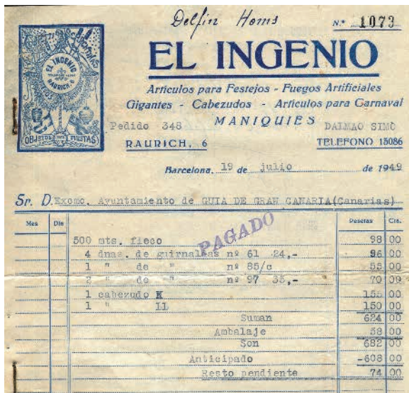
Factura de la compra de dos cabezudos, julio de 1949.