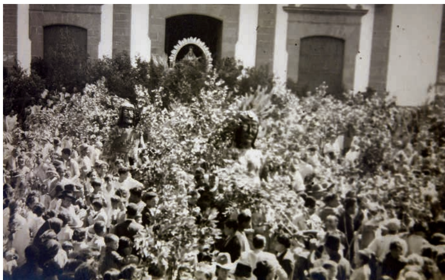
Fiesta de La Rama de las Marías de Guía, primeras décadas del siglo XX. Fundación para el Desarrollo y Estudio de la Artesanía Canaria (FEDAC)