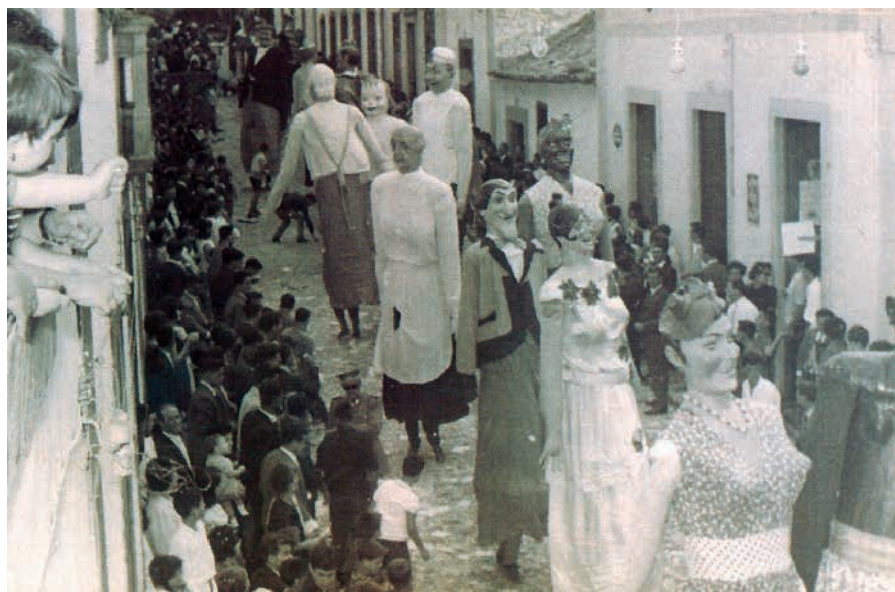
Fiestas de la Virgen de Guía, década de 1950.