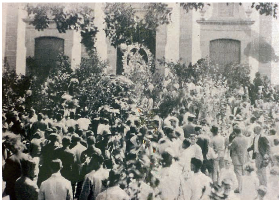
Fiesta de La Rama de las Marías de Guía. Primeras décadas del siglo XX. Autor desconocido. Fondo fotográfico Paco Rivero. Fundación Canaria Néstor Álamo)