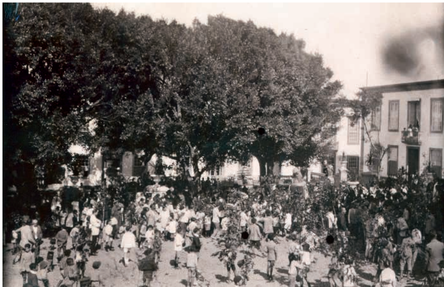
Fiesta de La Rama de las Marías de Guía. Primeras décadas del siglo XX.