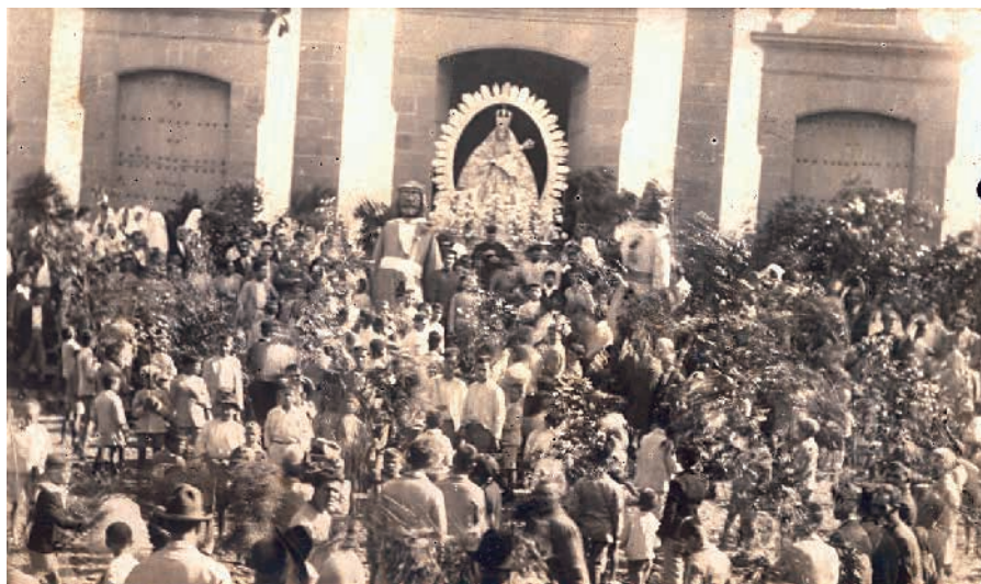
Fiesta de La Rama de las Marías de Guía. Primeras décadas del siglo XX.