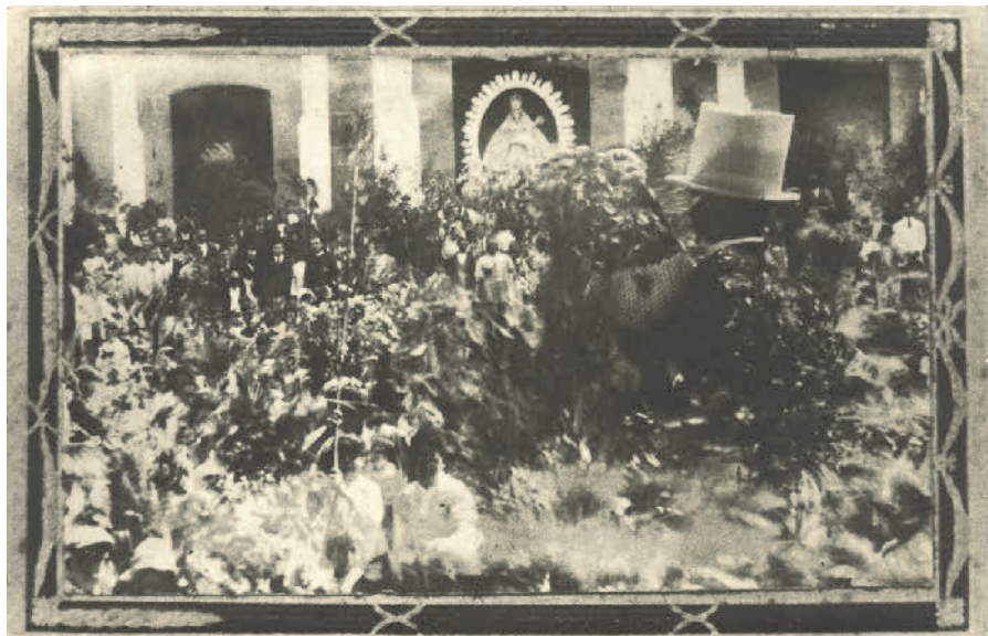
Fiesta de La Rama de las Marías de Guía, primeras décadas del siglo XX.