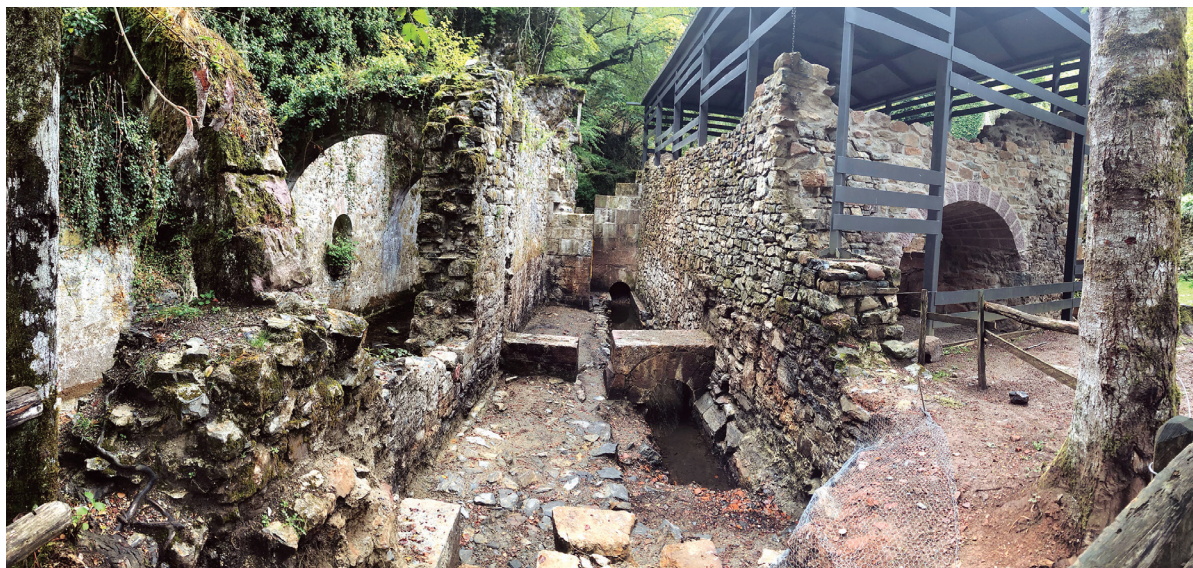
Figura 2. Vista general del curso fluvial, uno de los tramos de canal y el edificio de los hornos de fundición.

Se han documentado dos salidas del canal al curso fluvial, ambas de piedra sillería y arco rebajado. La primera (UE 367), de 0,70m de anchura, presenta caja (UE 367.1) para colocar una compuerta de madera que se abría cuando los tambores de pulido estaban inactivos, quedando el resto del canal cerrado por otra compuerta (UE 368) que existía junto a esta salida. La segunda salida (UE 361.18), ubicada a diez metros al oeste de la primera, tiene una anchura de 0,60m y carece de compuerta.