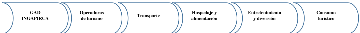
Figura 1: Eslabones básicos de la cadena de valor turística del GAD Parroquial Ingapirca

A partir de la información recolectada, se integran los eslabones básicos de la cadena de valor. La cadena de valor de la ruta turística del GAD Parroquial Ingapirca del cantón Cañar identifica distintos eslabones. Estos eslabones con precisión determinan elementos claves como; el producto, la prestación del servicio, hospedaje, alimentación, el agenciamiento, la movilidad como el uso de la transportación turística terrestre para llegar al destino como factor de intermediación.