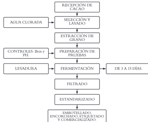
Figura 1. Fases de la producción de Vino de Mucílago de Cacao

concentre a tal grado que tendremos un vino de calidad. Aunado a esto, se obtiene el vino listo para ser embotellado, encorchado y etiquetado en recipientes de 750 ml.