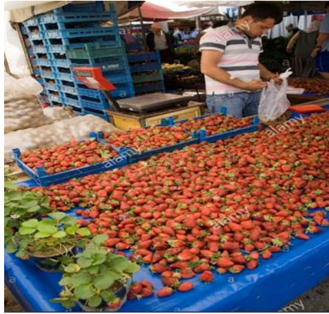
Fotografía 6: Pesaje con implementación