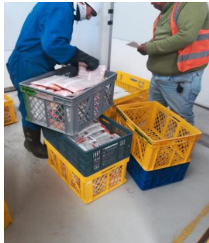
Fotografía 3: Transporte de producto terminado

Análisis.- Los datos cuantitativos de producción de la empresa están dados en tiempo real es decir corresponden a producciones en tres ejercicios diferentes entiéndase como producciones mensuales en la forma como se ha estado trabajando. Aplicando conceptos básicos de logística de planta hemos podido identificar falencias en los procesos de recepción de la materia prima, pesado, y transporte de producto terminado.