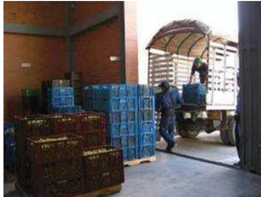
Fotografía 4: Recepción de materia prima

Para la recepción de materia prima se socializo con los proveedores la forma y manera de entra esto es en cubetas plásticas de 100 kg de capacidad apilables hasta 6 verticalmente, con este proceso mejorado se evitó el caos y desperdicio en la materia prima y la mejoría en tiempos de recepción.