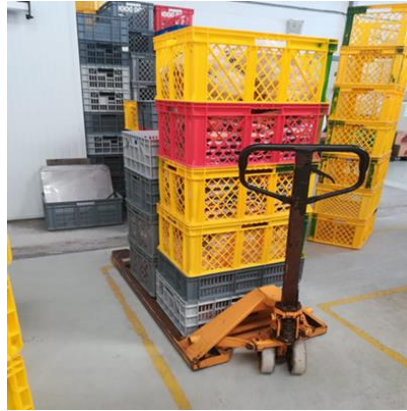
Fotografía 8: Transporte de materia prima