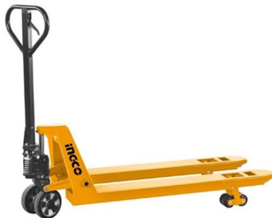
Fotografía 7: Montacargas manual implementado