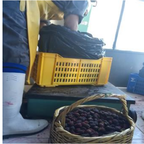
Fotografía 2: Pesaje de la materia prima