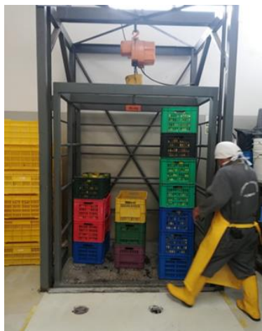
Fotografía 10: Elevador de carga aplicación