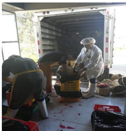
Fotografía 1: Recepción de la materia prima

Análisis.- La situación actual de acuerdo a los resultados, basados en la producción podemos manifestar que la productividad de la planta está determinado que por cada dólar invertido se produce 0,51 kg de pulpa de fruta, y es precisamente este parámetro el que la empresa está interesada en variar mediante el mejoramiento de los procesos logísticos, planteada en nuestra propuesta.