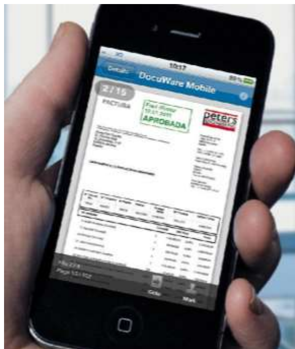
Ilustración 2 Factura Electrónica