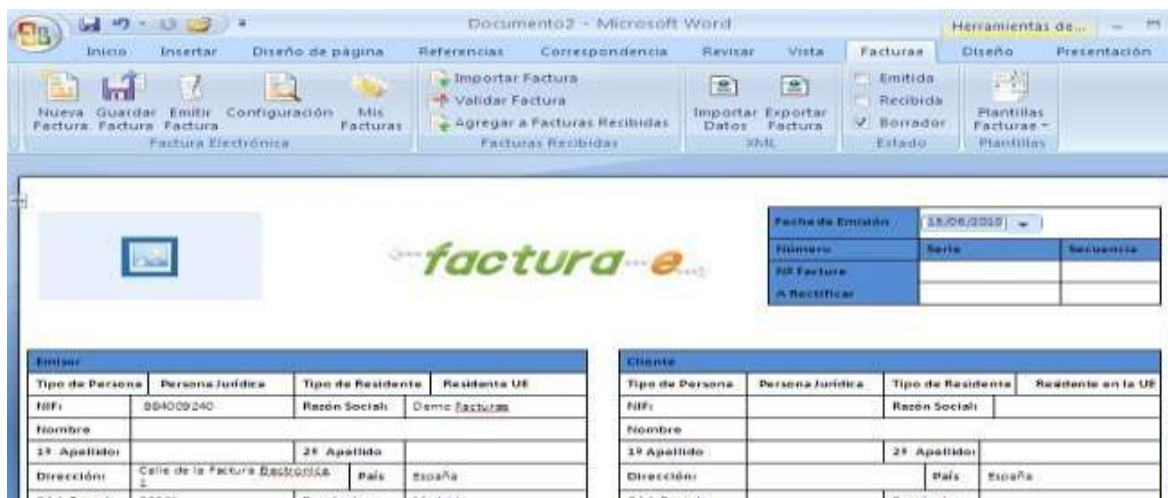
Ilustración 5 Verificación de Factura Electrónica