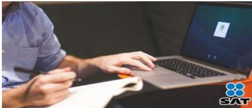
Ilustración 4 Verificación de Factura Electrónica