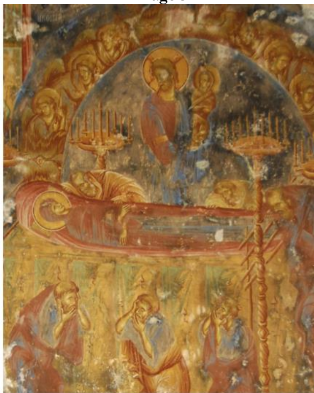
Mistra, Eglise de l'Hodigitria, portique sud, 1311/12-1322

Le troisième Sermon, le plus court, est essentiellement un résumé des deux précédents. La répétition des principaux éléments des deux premiers sermons laisse supposer que le troisième texte a été prononcé dans le temple de Gethsémané, tandis que les deux premiers dans le temple de Sion. 92 La référence de Jean Damascène à la résurrection de la Vierge est remarquable. 93 Saint Théodore-le Studite (759-826) présente brièvement les événements liés à la Dormition dans son court Sermon. 94 Selon l'auteur, la Vierge a prévu sa Dormition imminente et a exprimé son désir que les Apôtres soient présents, ce