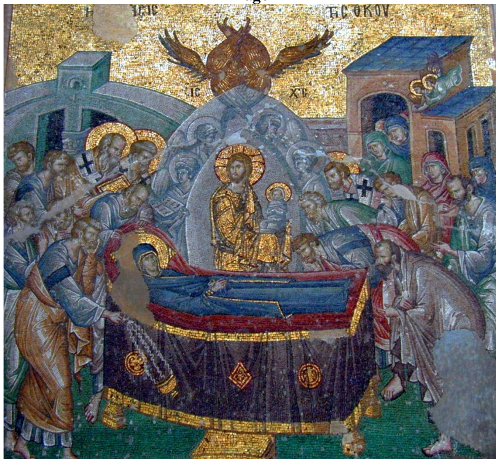
Constantinople, Saint-Sauveur-in-Chora 1315-1320 (détail)