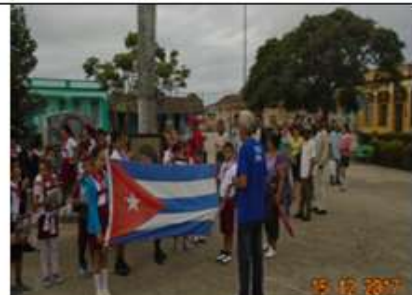
6to recorrido histórico. Obelisco a los soldados rebeldes caídos en combate. Diciembre de 2017.