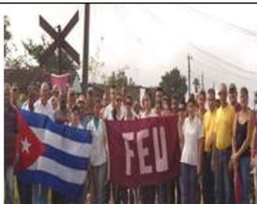
5to recorrido histórico. Cruce del ferrocarril en Piedra Gorda. 2016