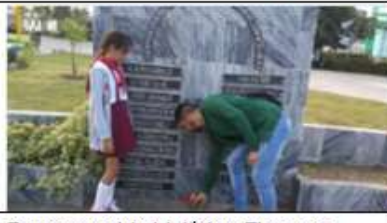
7mo recorrido histórico. Flores en homenaje a los soldados rebeldes caídos en combate. Diciembre de 2018.