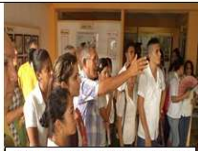
5to recorrido histórico. Exposición en la casa de los Combatientes. 2016