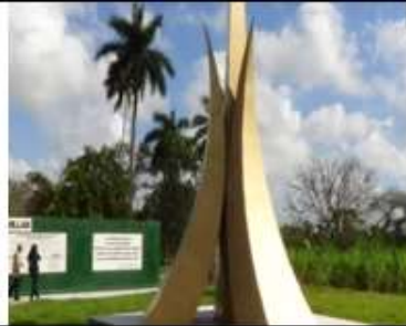
3er recorrido histórico. Lugar donde se firmó el Pacto del Pedrero. Febrero 2015