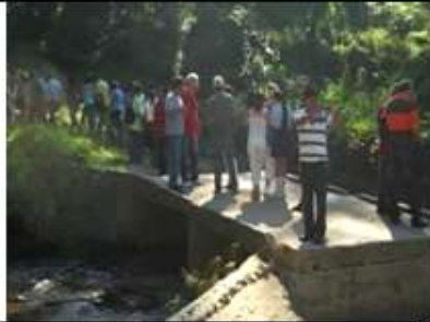
1er recorrido histórico. Puente sobre el río Sipiabo . 2014