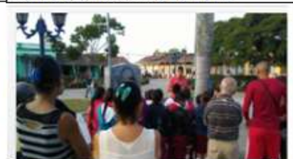
7mo recorrido histórico. Un intercambio con el Historiador de Fomento. Diciembre de 2018