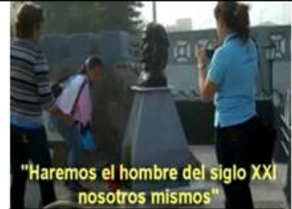
"Haremos el hombre del siglo XXI nosotros mismos"