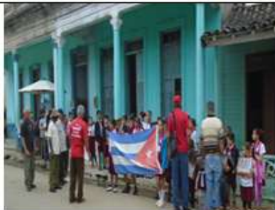
6to recorrido histórico. Lugar donde radicó la Comandancia del Che en Fomento. Diciembre de 2017.