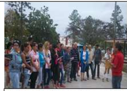
5to recorrido histórico. Obelisco a los soldados rebeldes caídos en combate. Diciembre de 2016