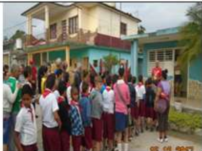
6to recorrido histórico. Salida del Centro Universitario de Fomento. Diciembre de 2017.