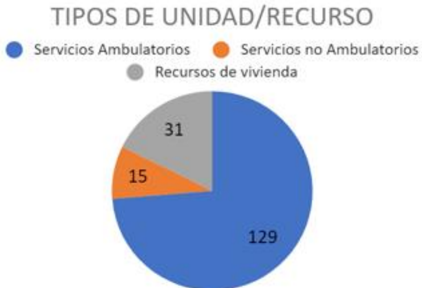
Figura 3 Tipos de unidad/recurso. Nota: Elaboración propia.