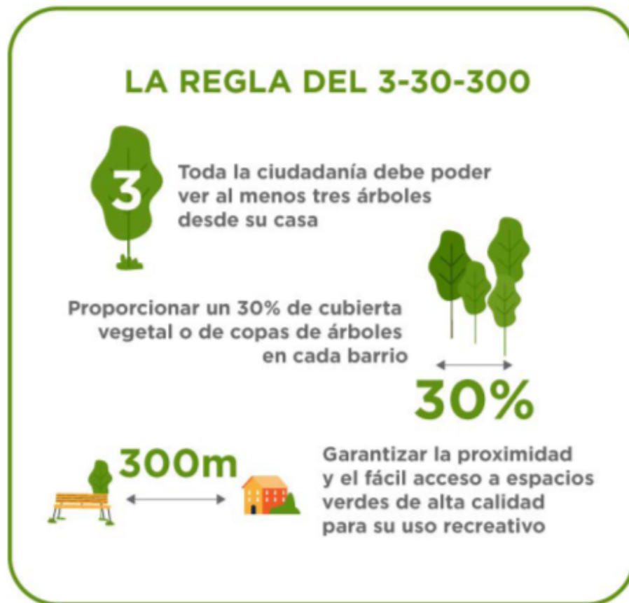
FIGURA 1 Regla 3-30-300.