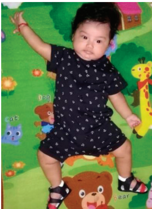
Figura 1: Paciente con síndrome de Down por mosaico, características clínicas leves

Al tercer mes de nacido es remitido al servicio de pediatría por presentar hipertermia (38°C), tos productiva, rinorrea bilateral amarillenta y acrocianosis s; es hospitalizado por ocho días con tratamiento de antibióticos (ampicilina y gentamicina); y dado de alta con diagnóstico de neumonía bacteriana, según consta en informes previos archivados en la historia clínica de la paciente. Al sexto mes de edad acude nuevamente a consulta externa por presentar hipertermia (38.5 C) rinorrea bilateral transparente, tos no productiva y sostén cefálico disminuido, motivo por lo cual se administra antibioticoterapia mas expectorantes vía oral por 7 días por diagnóstico de bronconeumonía y se solicita valoración psicológica de test de DENVER, el cual presenta una puntuación del 75%, correlacionándose este por debajo de la media para niños de su misma edad. Al noveno mes de edad se logra la atención por servicio de genética para valoración de retazo madurativo y cognitivo, en el cual luego de su valoración física observa pequeñas alteraciones faciales