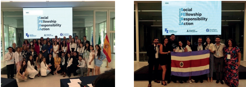
Imagen 4. Imágenes de la entrega de premios SFERA Experience 2022 en Monterrey.

A parte de las actividades, encuentros, visitas culturales y todo lo que conlleva este tipo de convivencias entre grupos de diferentes países, se establecieron contactos y sinergias entre profesionales de la documentación.