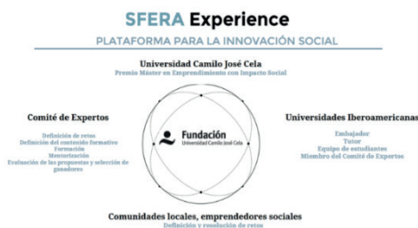
Figura 1. Programa SFERA Experience. https://fundacionucjc.org/experiencia-esfera/

Se trata de un espacio colaborativo de innovación social en el cual estudiantes de formación interdisciplinar pertenecientes a universidades iberoamericanas participan en una competición anual, donde trabajan en equipos para afrontar retos que supongan transformaciones sociales y medioambientales en favor de la comunidad local o global. En cada edición, SFERA plantea un gran desafío global asociado a los Objetivos de Desarrollo Sostenible, y el equipo de estudiantes representante de cada universidad compite por la búsqueda de las ideas más innovadoras y con mayor impacto social para su resolución. En la primera edición, el gran reto ha sido “La educación en contextos vulnerables” y en la segunda edición, “La educación en derechos humanos”.