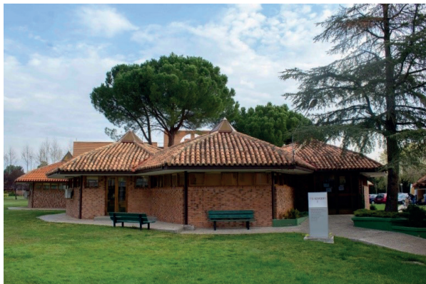
Imagen 5. Instalaciones de la Biblioteca UCJC en Villafranca del Castillo.