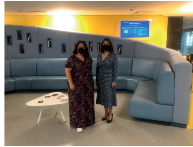
Imagen 4. Imágenes de las sinergias establecidas entre bibliotecas con el personal de la Universidad de Cork y el TEC de Monterrey.

Como parte de estas colaboraciones, una de las responsables de la Biblioteca de la Universidad de Cork realiza una visita a la Biblioteca de la UCJC para conocer la implementación de la Agenda 2030 y de los ODS dentro de nuestra comunidad universitaria. En esta visita, la bibliotecaria de Cork conoce las instalaciones de la Biblioteca del Campus de Villafranca de la UCJC, con el fin de que conozca el funcionamiento y desarrollo de nuestras actividades diarias y proyectos vinculados a la sostenibilidad, como por ejemplo la ecohuerta UCJC, la campaña de “Relatos compartidos” desarrollado con la UOC y bibliotecas universitarias y públicas, la biblioteca de semillas, etc. A partir de este momento se entabla contacto directo entre dichas universidades para poder realizar acciones conjuntas ecológicas y sostenibles en el futuro desde nuestros centros.