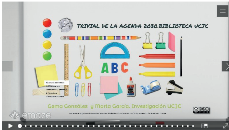
Figura 3. Trivial Agenda 2030 UCJ [ii]. Elaboración: Biblioteca UCJC.