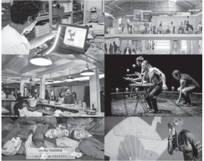
Figura 7. Actividades en la Isla Creativa .

Otras miradas sobre el paisaje industrial. La isla de Zorrozaurre Another gazes on the industrial landscape. The island of Zorrozaurre