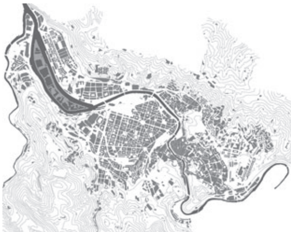
Figura 4. Localización de la Isla de Zorrozaurre en Bilbao. Elaboración propia sobre información cartográfica del Ayuntamiento de Bilbao (2022).