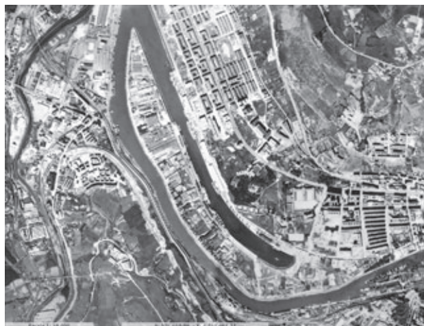
Figura 5. Ortoimagen de la península de Zorrozaurre y el Canal de Deusto en 1970. Diputación Foral de Bizkaia.