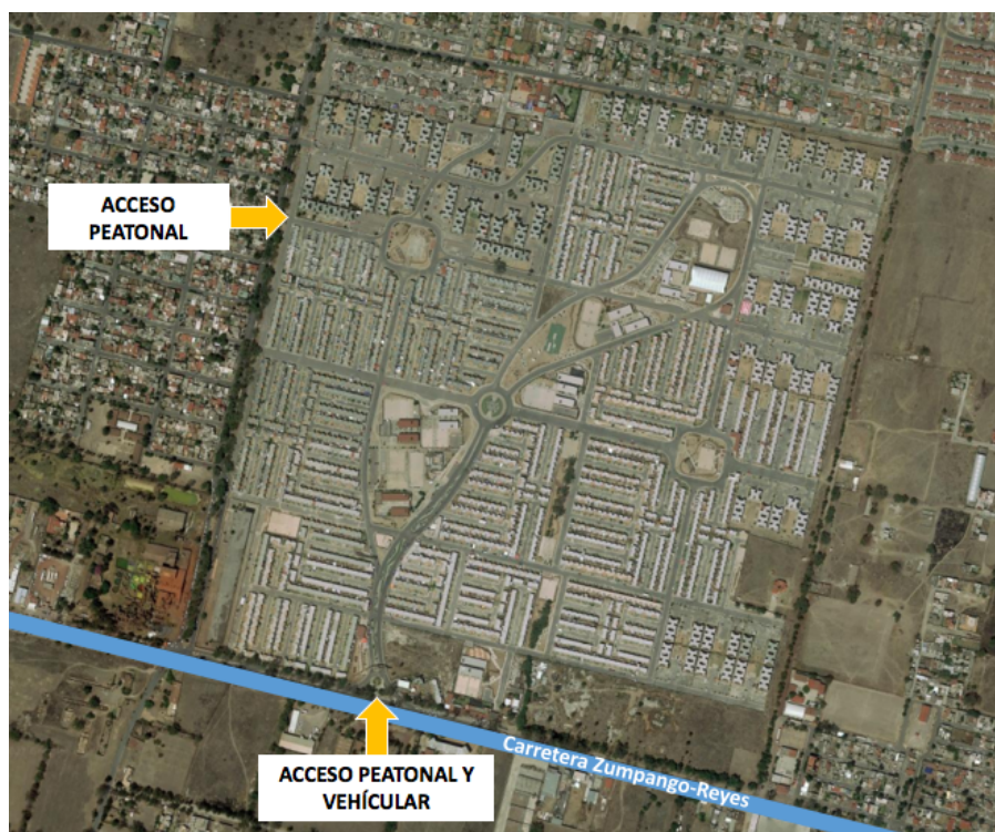
Figura 2. Localización del conjunto urbano.

Paseos del Lago II es uno de los más de 30 conjuntos urbanos en el municipio. Se encuentra ubicado a 3.6 kilómetros al oriente de la cabecera municipal, sobre la carretera Zumpango-Los Reyes Acozac. El mencionado conjunto urbano ocupa una extensión de 7.2 hectáreas, en lo que antes fue el denominado Rancho “Bonito”. Cuenta con un total de 6,023 viviendas particulares. De estas, 3,094 son viviendas habitadas, 2,668 son viviendas deshabitadas y 261 son viviendas de uso temporal (INEGI, 2021). La zona aledaña a este conjunto es primordialmente zona urbana, como se aprecia en la figura 2.