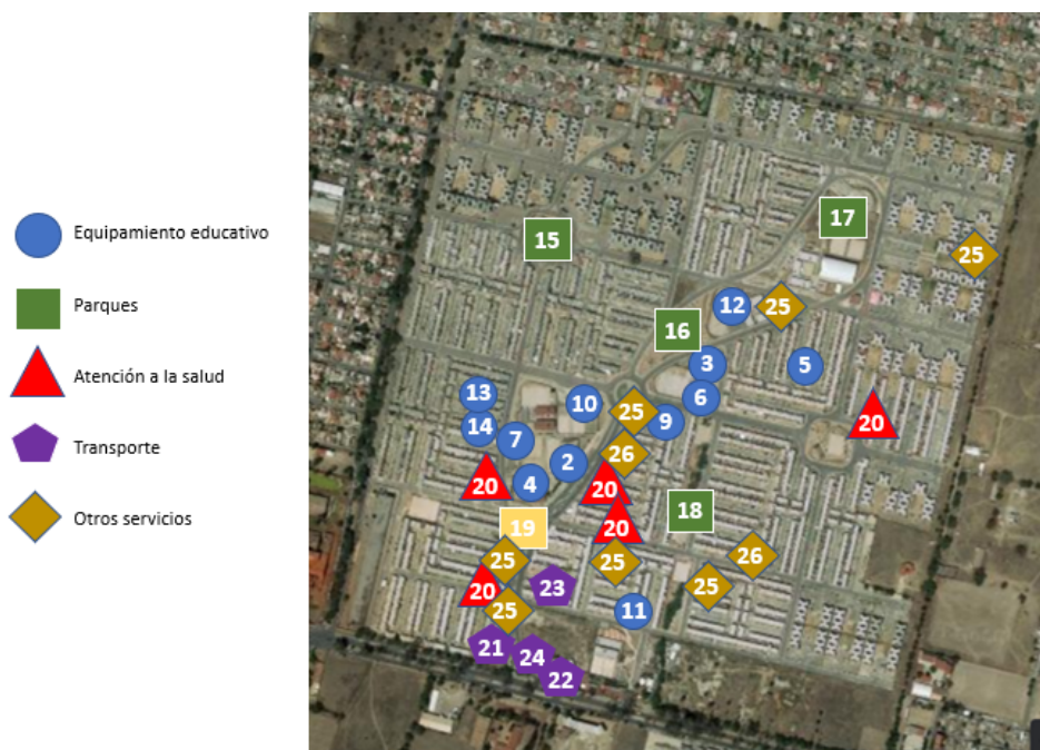
Figura 3. Ubicación del equipamiento al interior del Conjunto Urbano.

De igual forma, la figura 3 muestra la ubicación espacial de dicho equipamiento dentro del conjunto urbano, obtenida después de realizar los recorridos en campo.