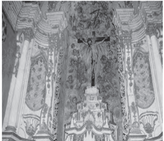
Figura G. Representações das categorias Expectativas e Religião.

A categoria Religião (Figura G) foi representada apenas por 3,3%.