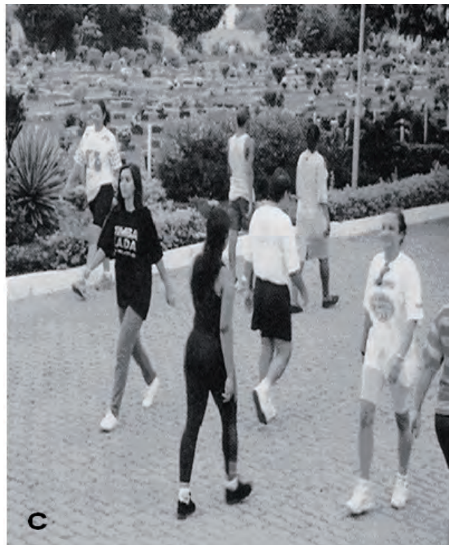
Figuras A, B e C. Representações das categorias Relações Humanas, Organização e Natureza