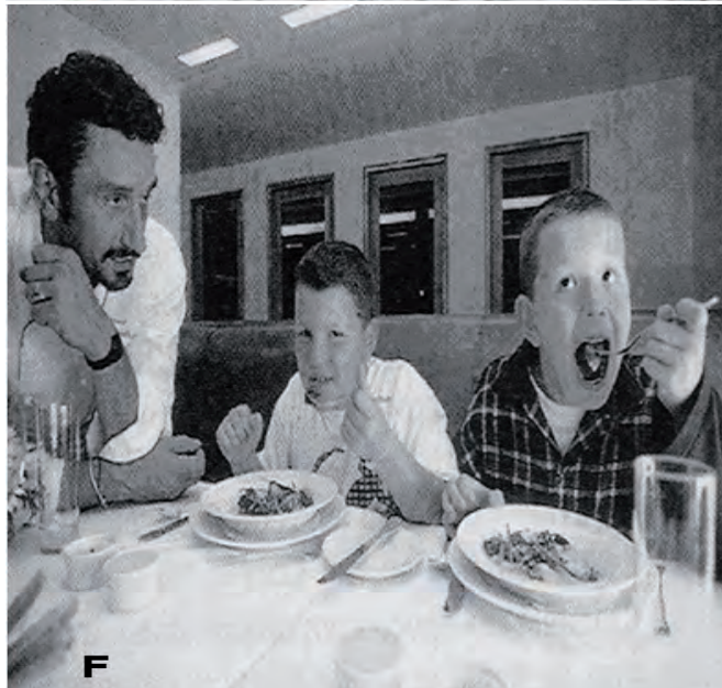
Figuras D, E e F. Representações das categorias Risco, Felicidade e Família

A categoria Religião (Figura G) foi representada apenas por 3,3%.