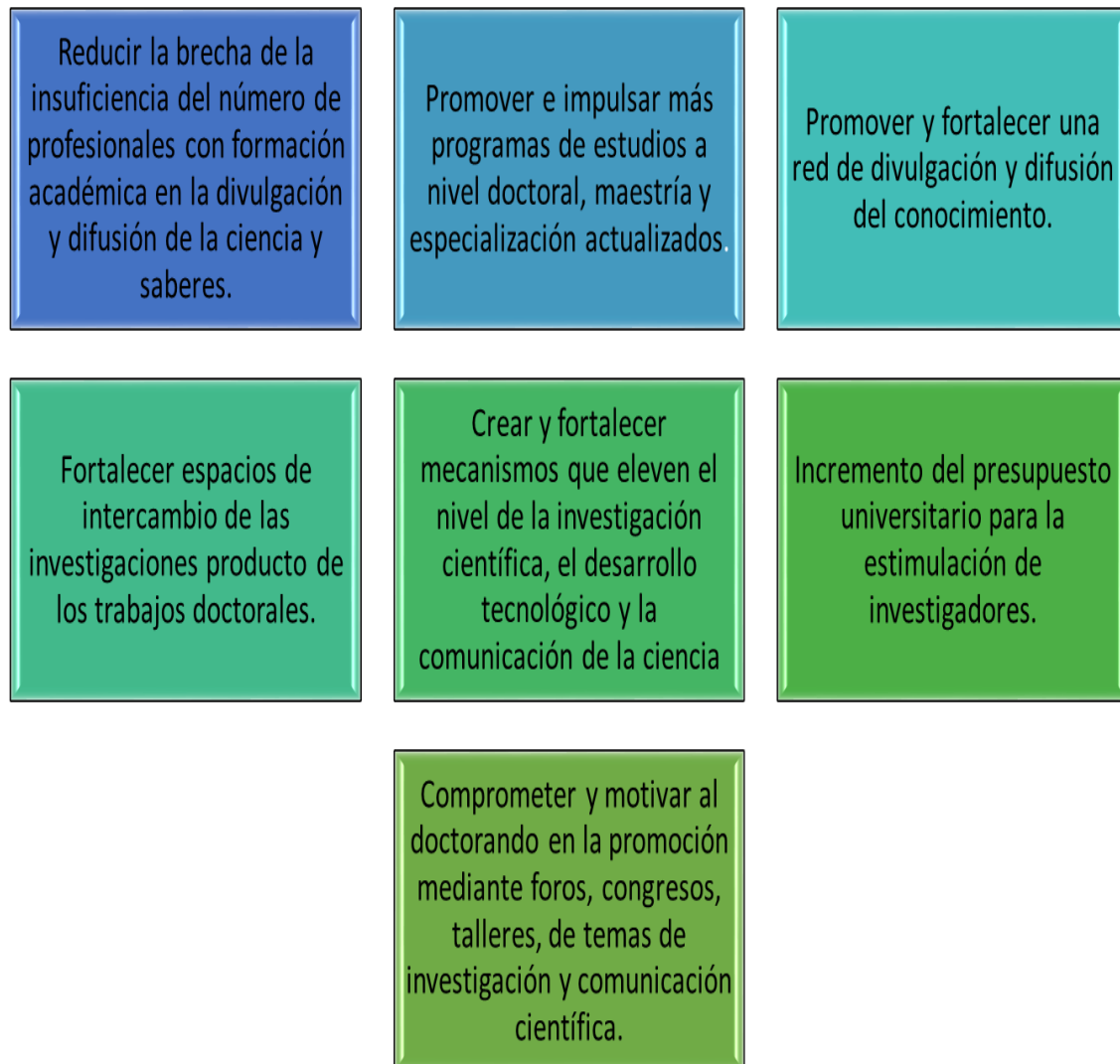
Figura 2. Retos de divulgación y difusión. Elaboración: Los autores.

En la siguiente figura se muestran algunos de los retos que se deben enfrentar para la divulgación y difusión del conocimiento desde la formación doctoral.